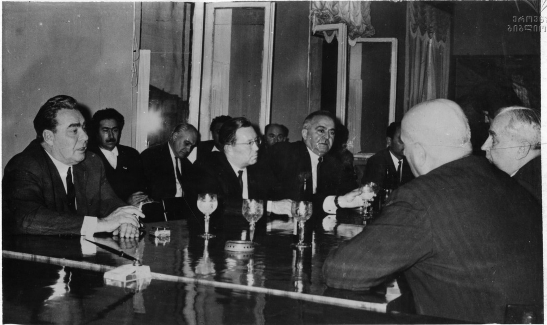
სანაგომს დათვალნიარაგის შეხრეზ დ. ი. ბაქენავი უსაუბრა აუსთავის მფალარკიული ქაახნის დიკაქვოას ს. ა. შა- აკენიქეს და სეპერთვედოს კოფეაკვიის აუსთავის სეპედამო კოფიქვავის ვიკვიდ მღივანს დ. ს. ხაგბერიას. სუკათუზე: საუბრის დროს