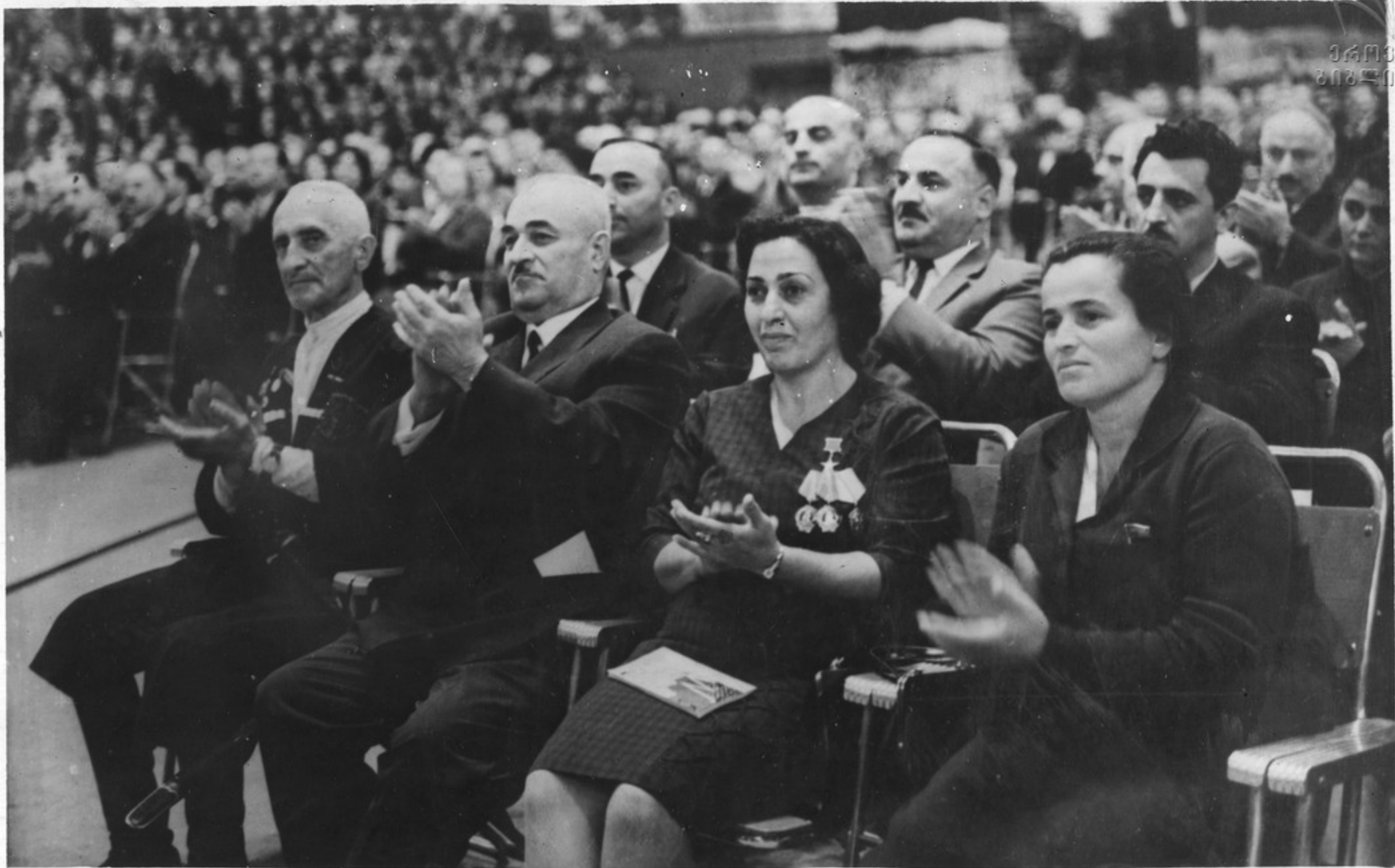
თბილისის სპორტის სასახლა. საქართველოს სს ჩენკაბადიანის სახელის ორდენის პარაოლიმპიკი ვიქტორია საზიშოო კაპის დაჯილდოება.