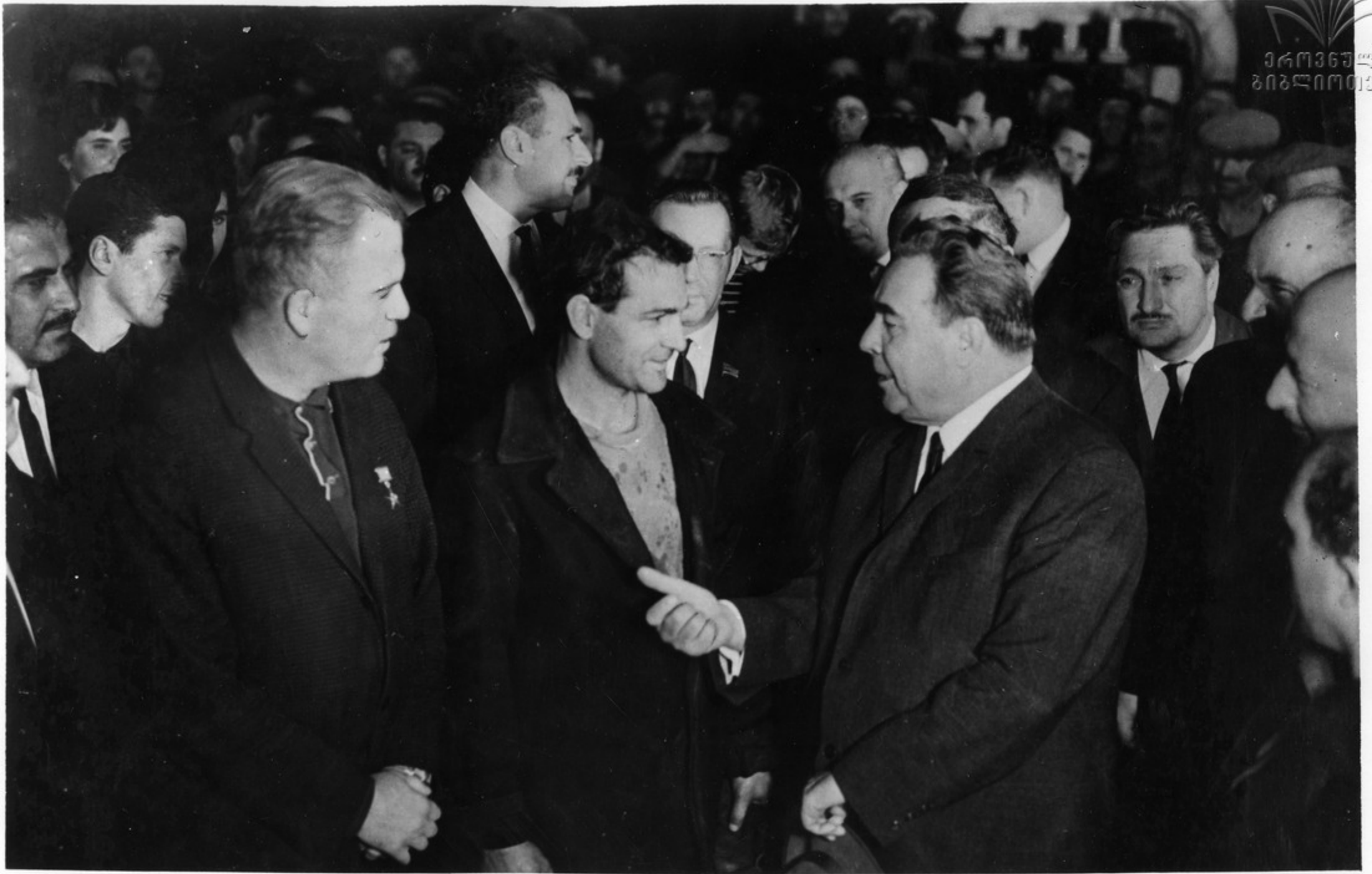
დ. ი. ბაქაძე ახსენის მფარველი ქაზნის მფარველს შიკის.