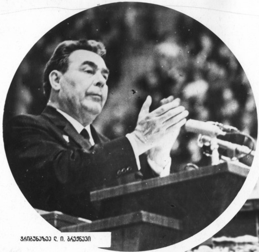
საბჭოთა კავშირის პრემიერ-მინისტრი ლ. ი. ბრეჟნევი

საბჭოთა კავშირის პრემიერ-მინისტრი ლ. ი. ბრეჟნევი, რომელსაც დაესწარნენ მთელი საქართველოს მოსახლეობა.