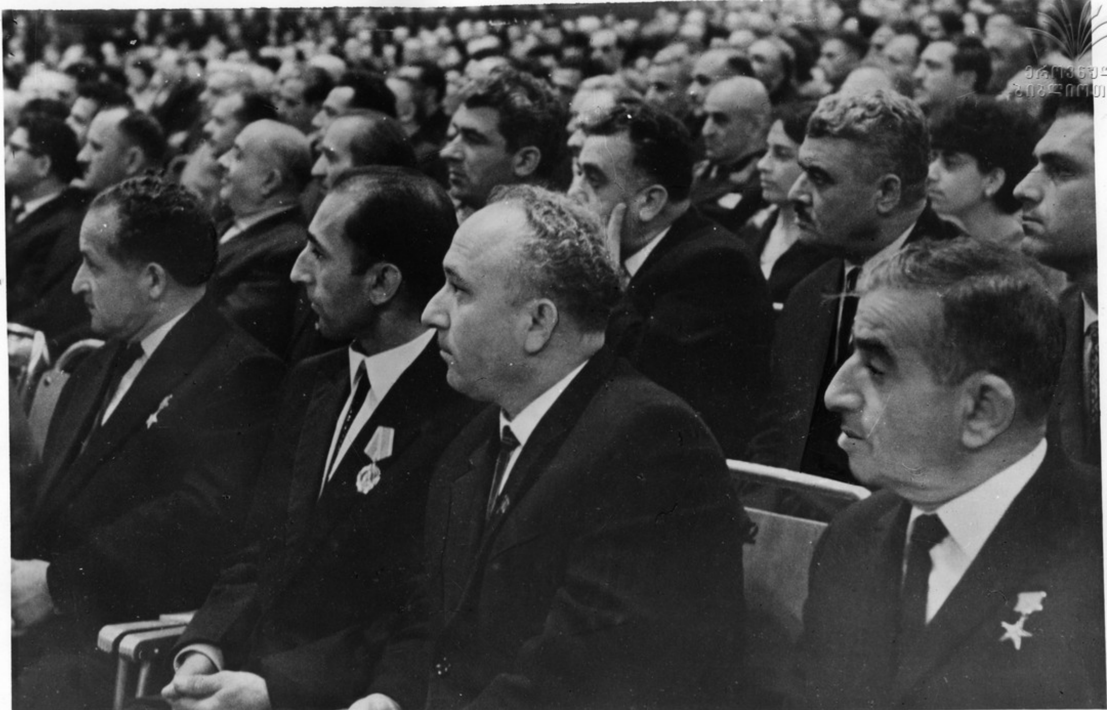
თბილისის სპორტის სახეობა. საქართველოს სს ჩესკოსლოვაკიისეთვის დანიის ოკრუგის გადასახლებისათვის მიძღვნილი საზეიმო კაბის დაკრუვა.