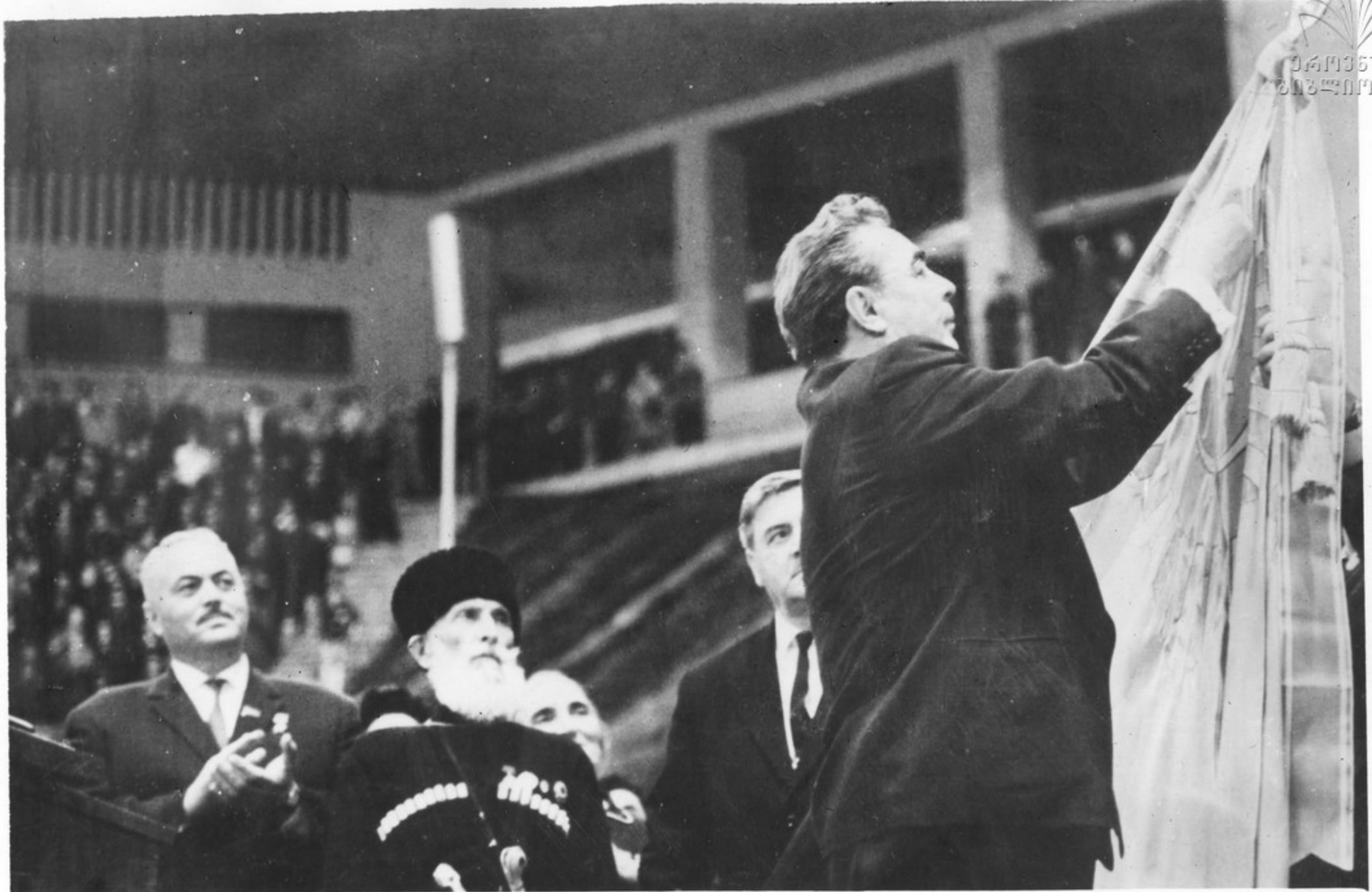
სკკს ტანჯაღუაჩი კოშიფაჳის გენაიაღუაგა მღიჳანაგა, სსა კაჳშიაჩის უგაღღასი საგჳოს ჳაეზირიუშის ნაჳკაგა აგაბა- ნაგაგა ღაღონიღ იღიან ჳე გაეჳნაგაგა ღანიღის ოაღანი მიგაგნია საჳაათჳაღღოს სს აისჳაგღიკის ღაღაგას. ჳაჳას საზაიღო ოჳასია. მთაღი ღაგაგაზი უაგაგა ღგაგა ღა მბუაგაღაღ გაგოგაგაგას ღიღ გაღღაგას ჳაგაგიღსა ღა მთაჳაგოგისაღღი საჳაგოგ ჯიღღოს გაგო. უაგაგაღი 17 საღღასას ფოტოჳაროგია