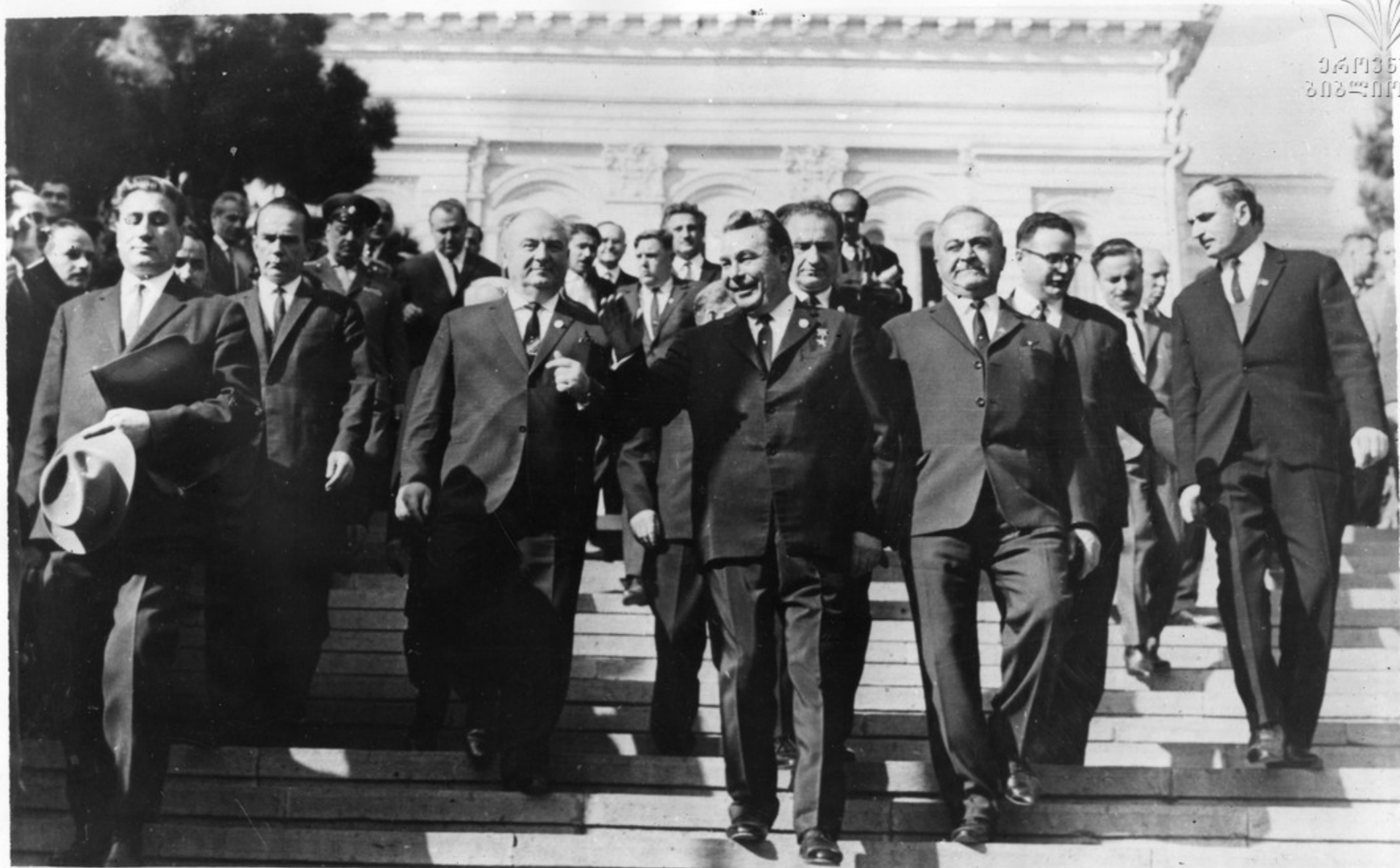
1966 წლის 31 ოქტომბერს თბილისში ჩამოვიდა სკკპ ცენტრალური კომიტეტის გენერალური მდივანი, სსრ კავშირის უმაღლესი საბჭოს წევრი ანდრეი პოდკორნოვი, რომელიც ილიას ქუჩაზე გაემგზავრა, რათა დაესალომებოდა გენერალის მდივანს. საპატივსაცემო დარბაზის მამულები გენერალს და გენერალს შეუძრავნ მისთვის სწავლას. სურათზე: დ. ი. პოდკორნოვი გენერალის მდივანს.