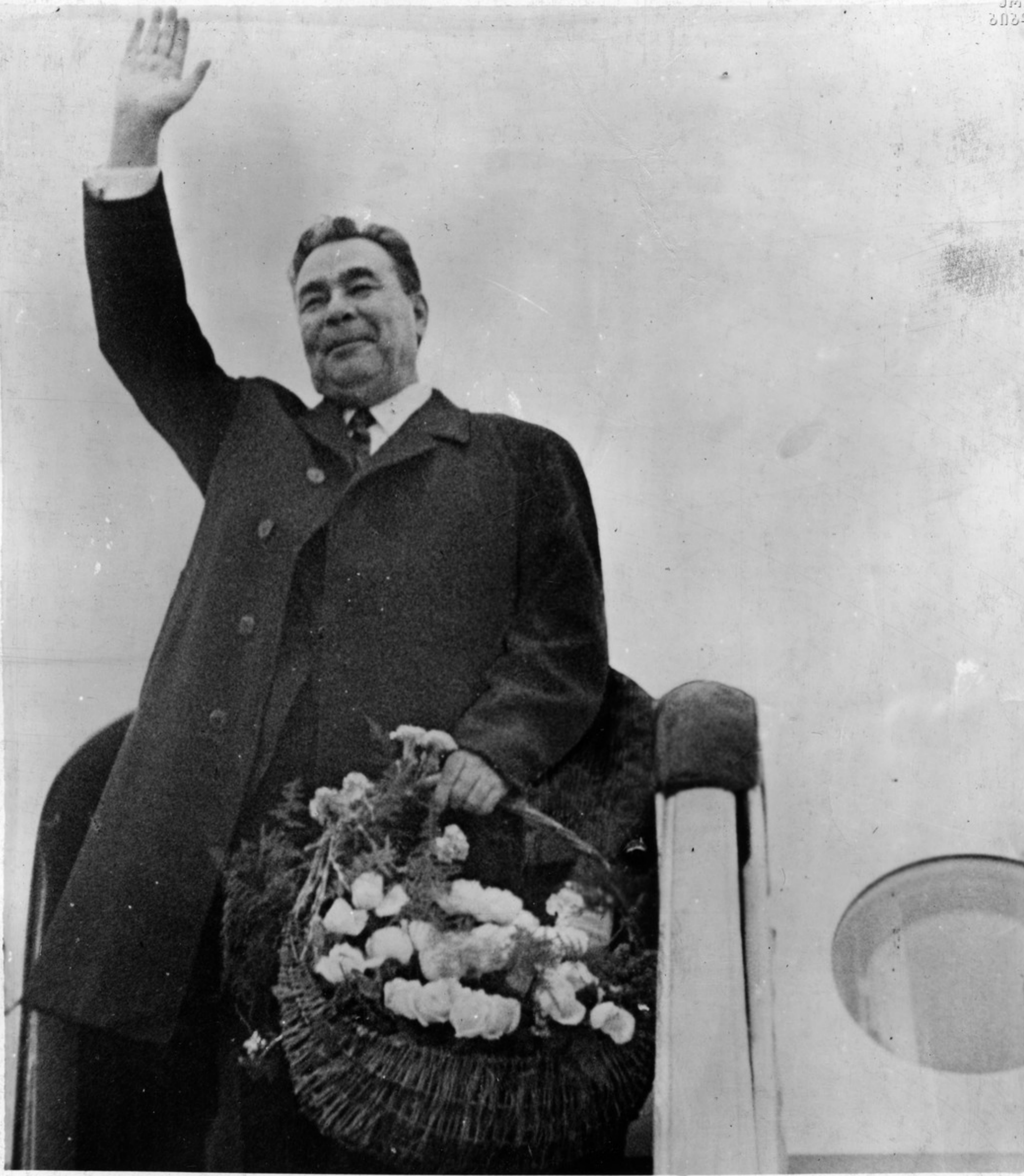
სკკპ ცენტრალური კომიტეტის გენერალური მდივანი ებხანაძე დ. ი. ბრატსკი უკრაინას ტერიტორიაზე მისაღებად გაგზავნილია ნიწ.