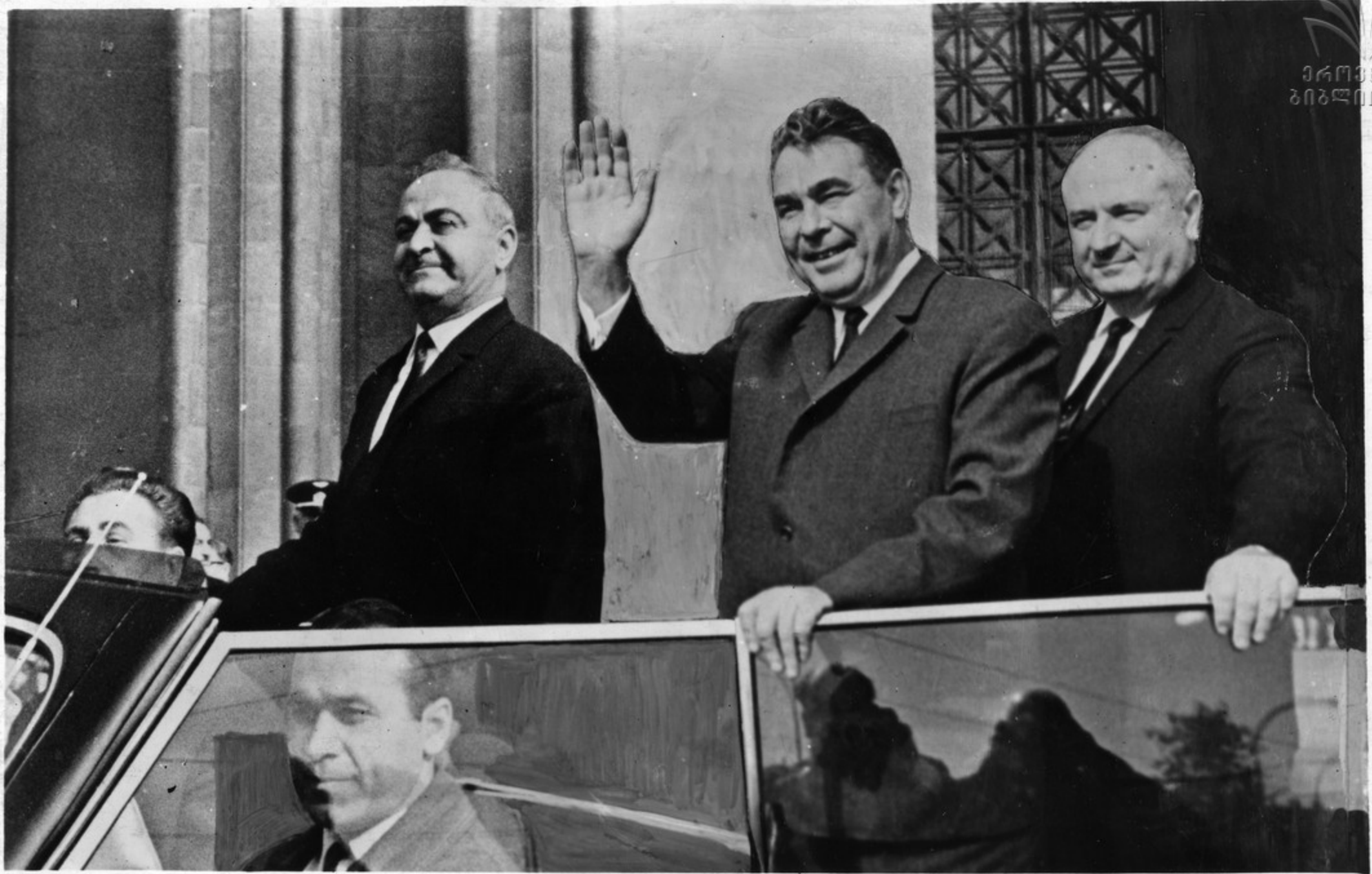
დ. ი. ბაკუნავი უკანუხავს თბილისადთა მისადმეგავს.