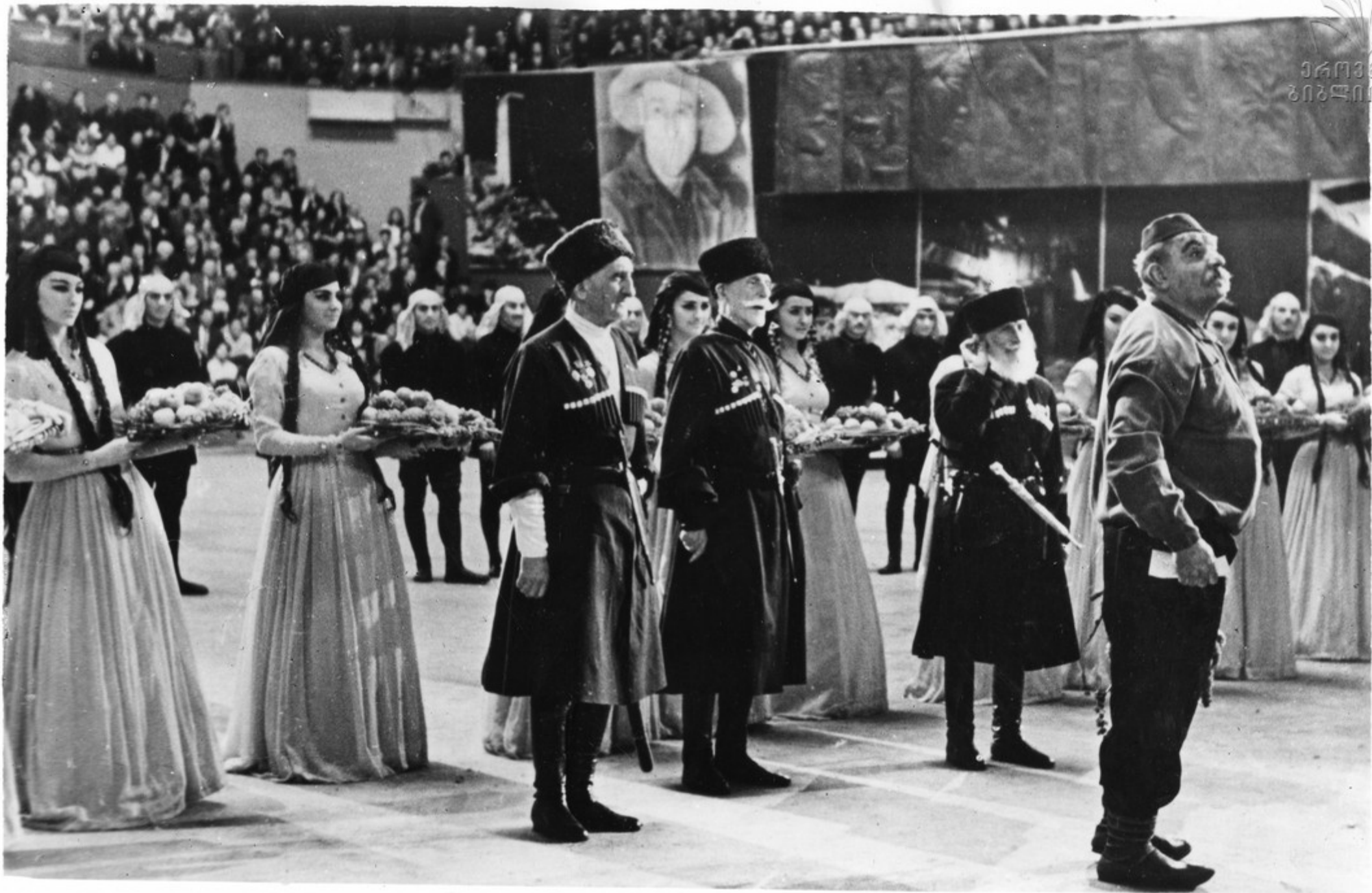
1 ნოემბერს ჩესკოსლოვაკეთის დანიის ბეოკა ოკრუგის ბარათების შექმნა, თბილისის სპორტის სასახლეში გაი- გაჩვენა დიდი საღმრთოთა კონსტანტი. სუათუბ: კონსტანტის ეთ-ეთი ნომაი.