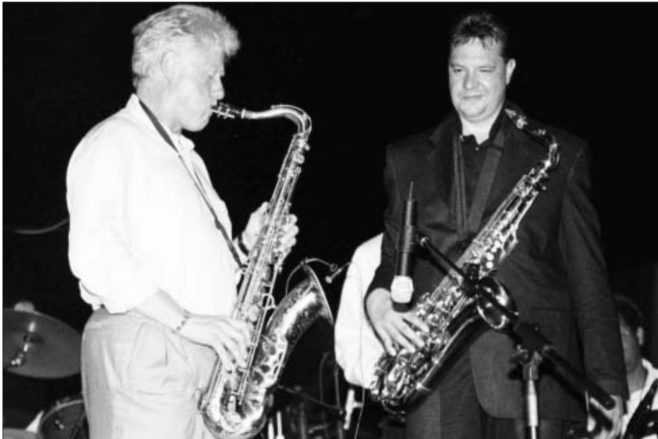
ბილ კლინტონი კოლუმბიელ მუსიკოს ალვარო როდრიგეზთან ერთად კართაგენაში 28 ივნისს

ათი წელი გავიდა მას შემდეგ, რაც ბილ კლინტონმა MTV-ის ეთერში საქსოფონზე კომპოზიცია შეასრულა და ხუმრობით საკუთარ საცვლებზეც გულლიად ისაუბრა. ეს კლინტონმა 1992 წლის საპრეზიდენტო კამპანიის ფარგლებში გააკეთა. ხანგრძლივი შესვენების შემდეგ ექს-პრეზიდენტი MTV-ის ეთერს კვლავ უბრუნდება, მაგრამ გაცილებით უფრო სერიოზულ ამბულაში – ის შიდსის გლობალური