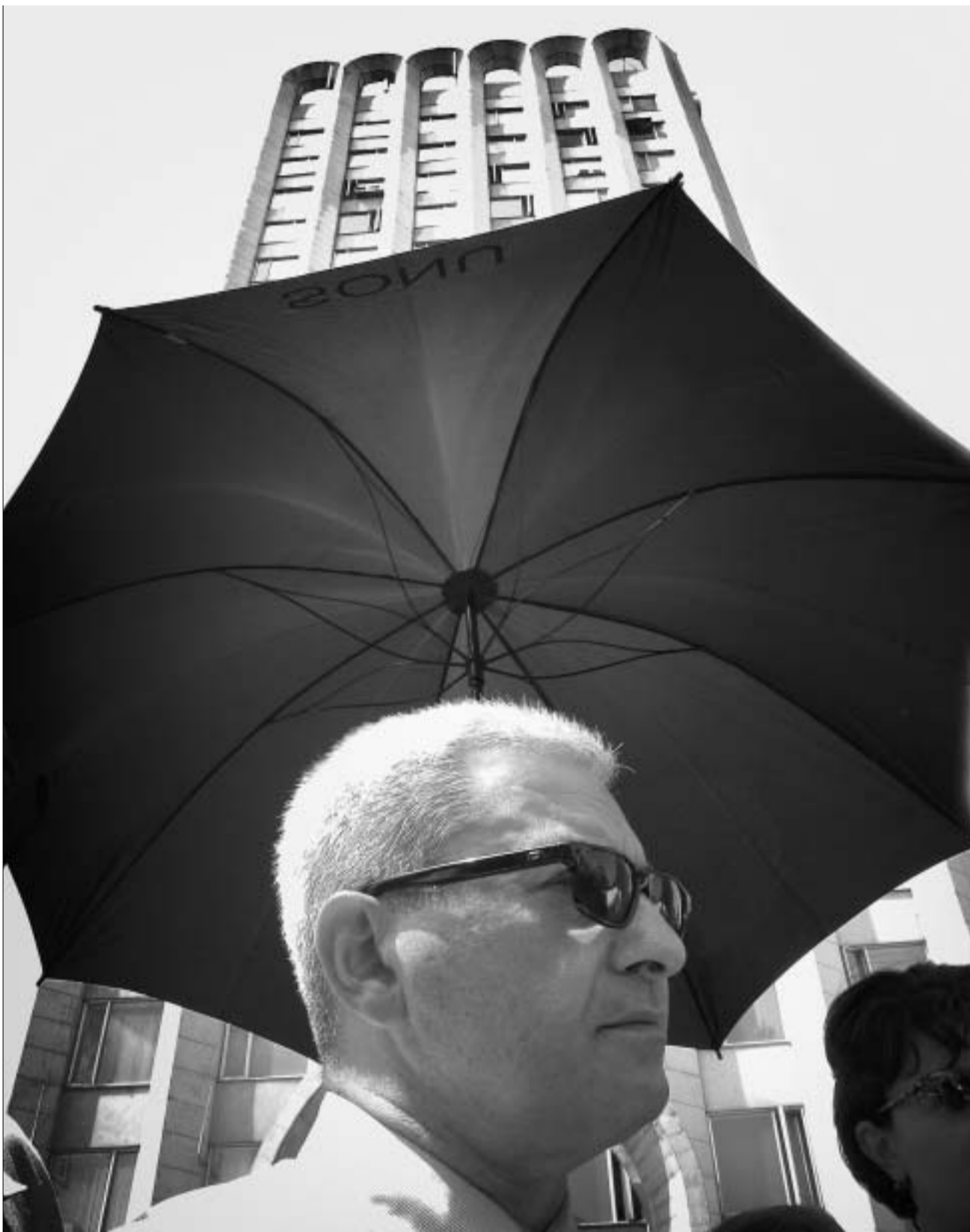
აქციის მონაწილეებს წვიმაში მიხვდნენ შეუბღალა ხელი