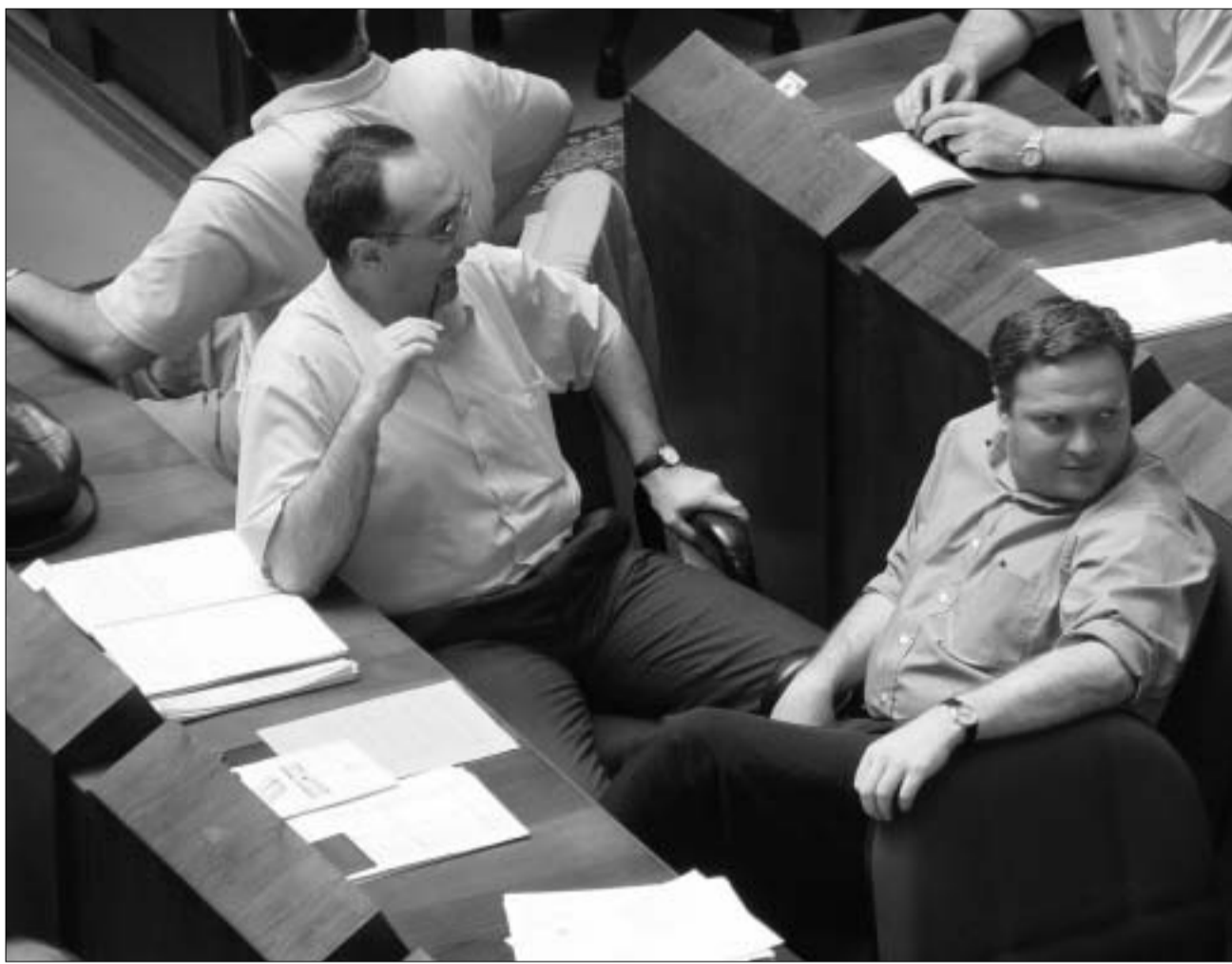
პარლამენტარები წერილობრივ კონკლავში გაიხილნენ.