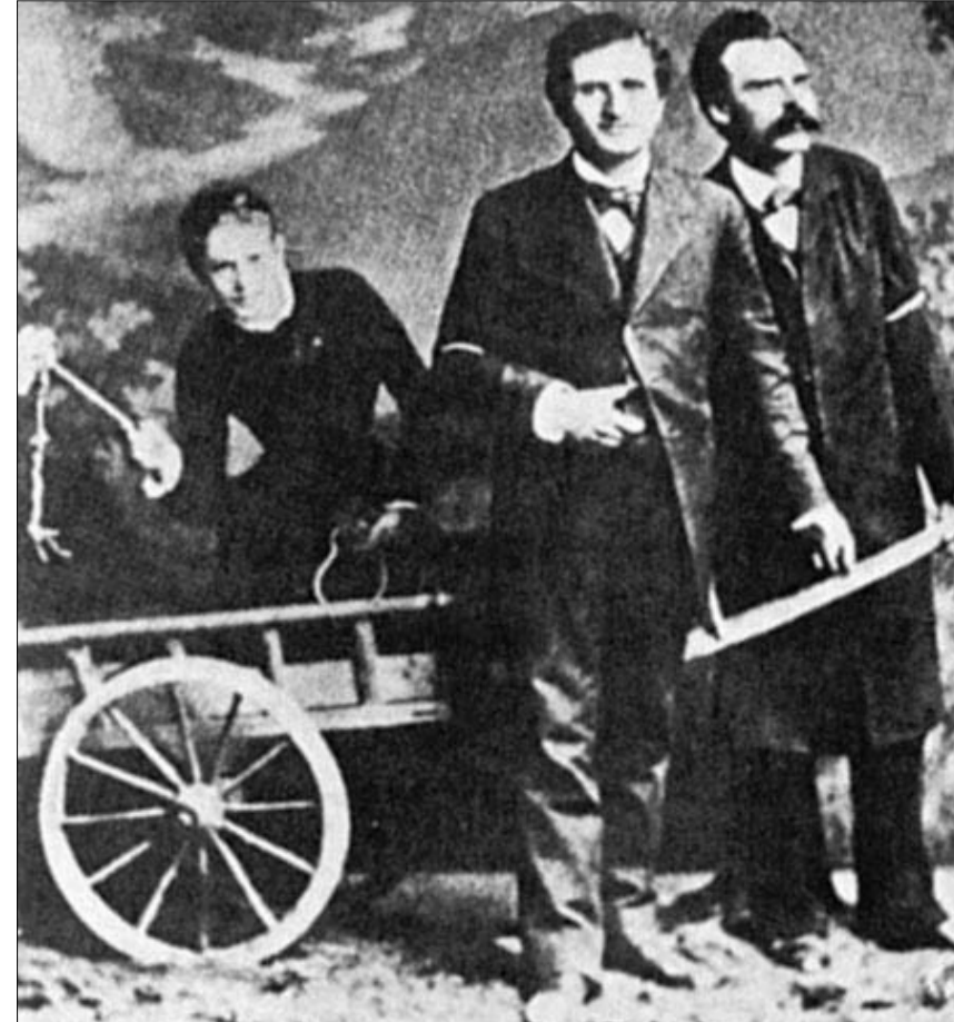
ლუ. პოლ რე. ნიცემ

ამიტომ, ჩემთვის უცნაურად ჟღერს ლუ ანდრეას-სალომეს მიერ 1937 წელს წარმოთქმული უკანასკნელი სიტყვები: „მთელი ცხოვრება მხოლოდ ემუშაობდა. რისთვის?“ ნუთუ ამქვეყნიდან ეს ქალიც უკმაყოფილო ნაივდა?!