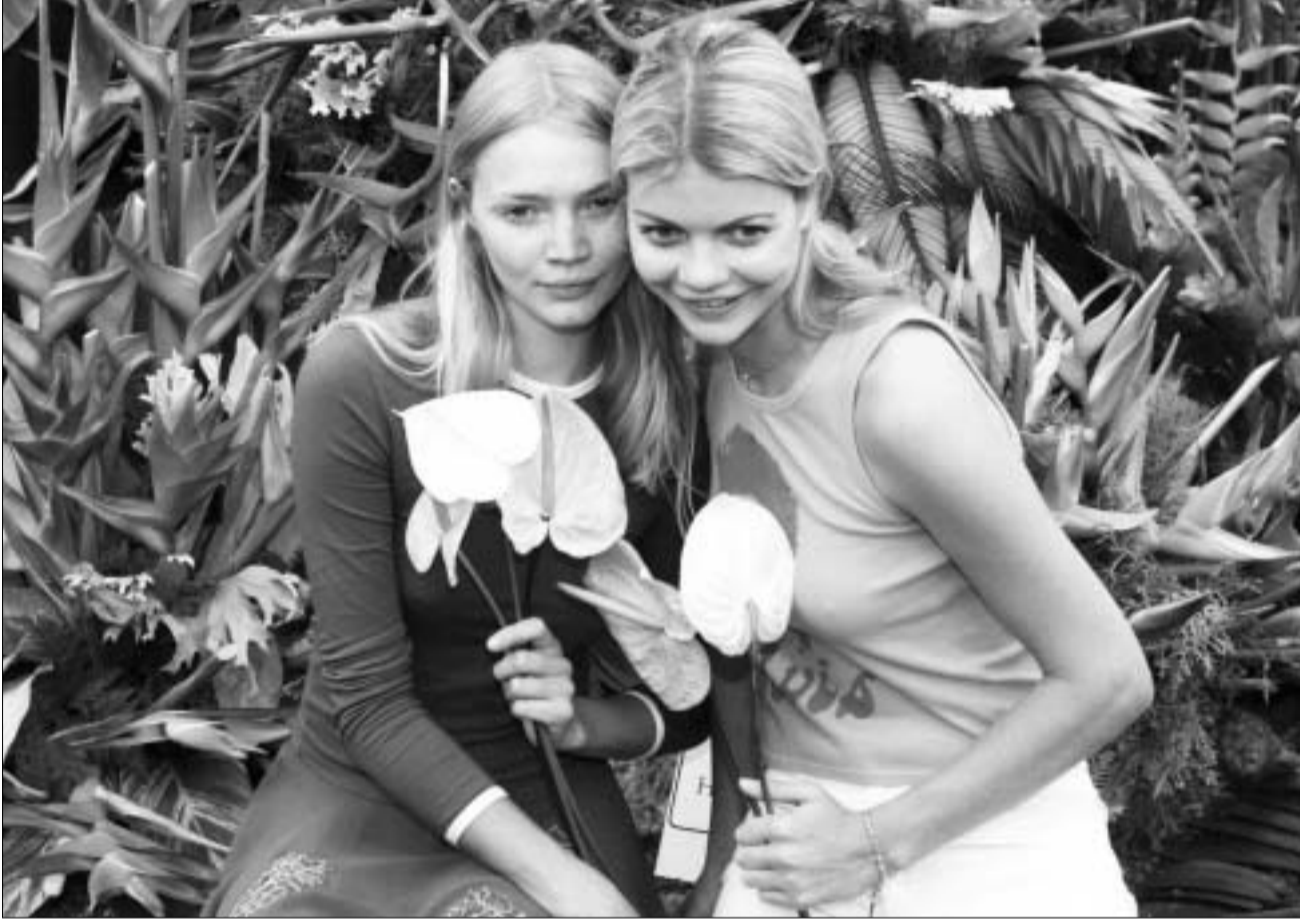
ფოტომოდელი ბაღების ფესტივალზე