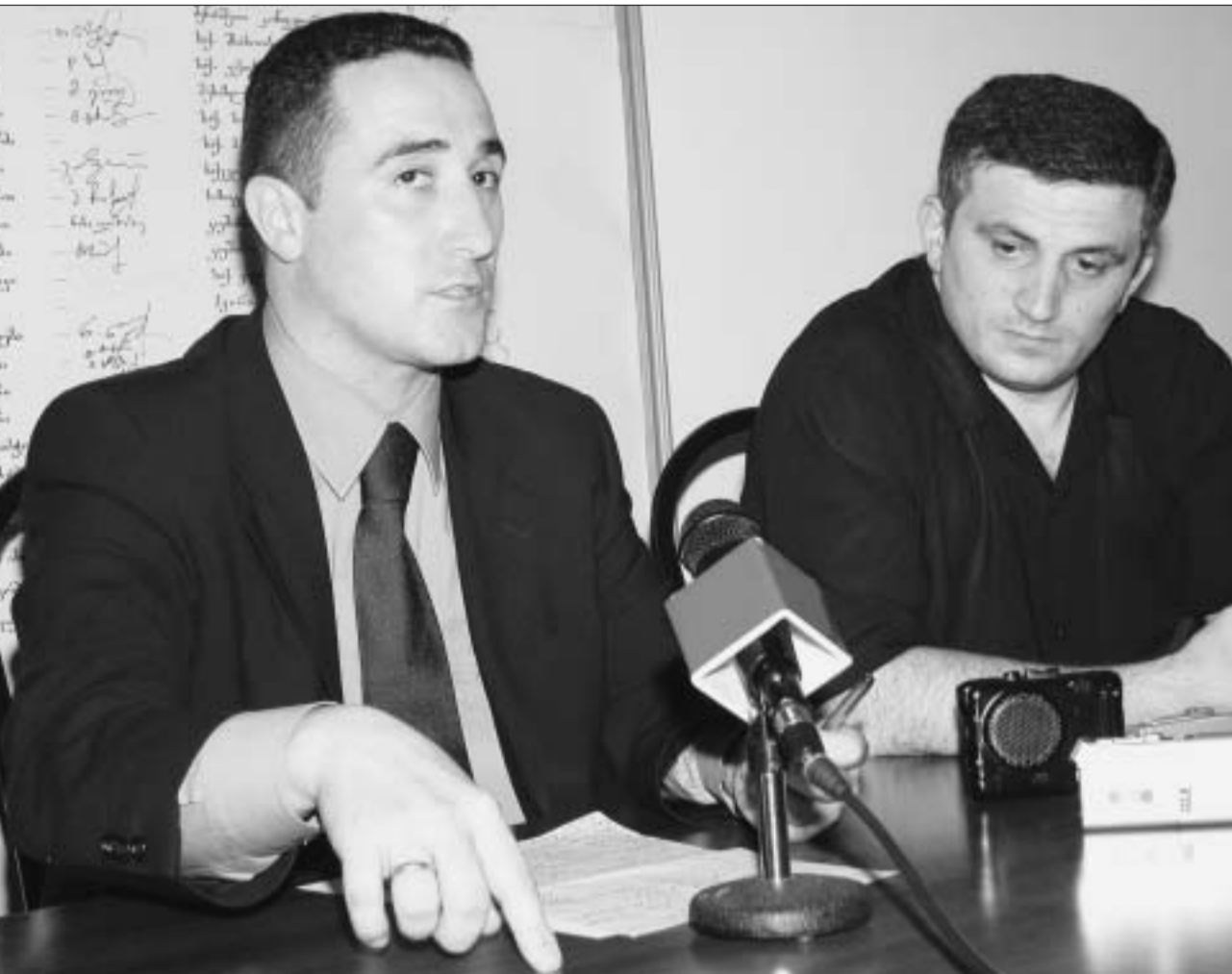
„გუზნებით. მათ სახეიმოდგომოდ რაღაც აქვით რაფიქრებელი“