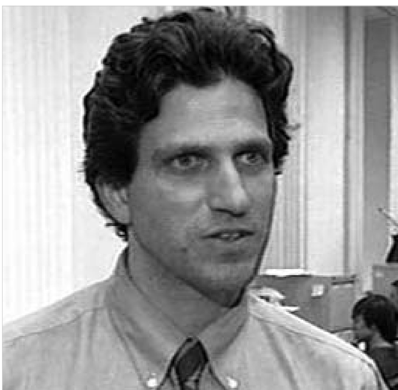
ხლებნიკოვის მკვლელობაში ბრალდებულნი სსსრთლი დარბაზიდან გაათავისუფლეს.

რუსული გაზეთის „ურეშია ნივოსტის“ ცნობით, რუსეთის გენერალურმა პროკურატურამ მიაკვლია მტკიცებულებები, რომლებიც დასტურებენ, რომ 2004 წლის ზაფხულში მოსკოვში მოხდა დარ წველაზე გახმაურებულ -