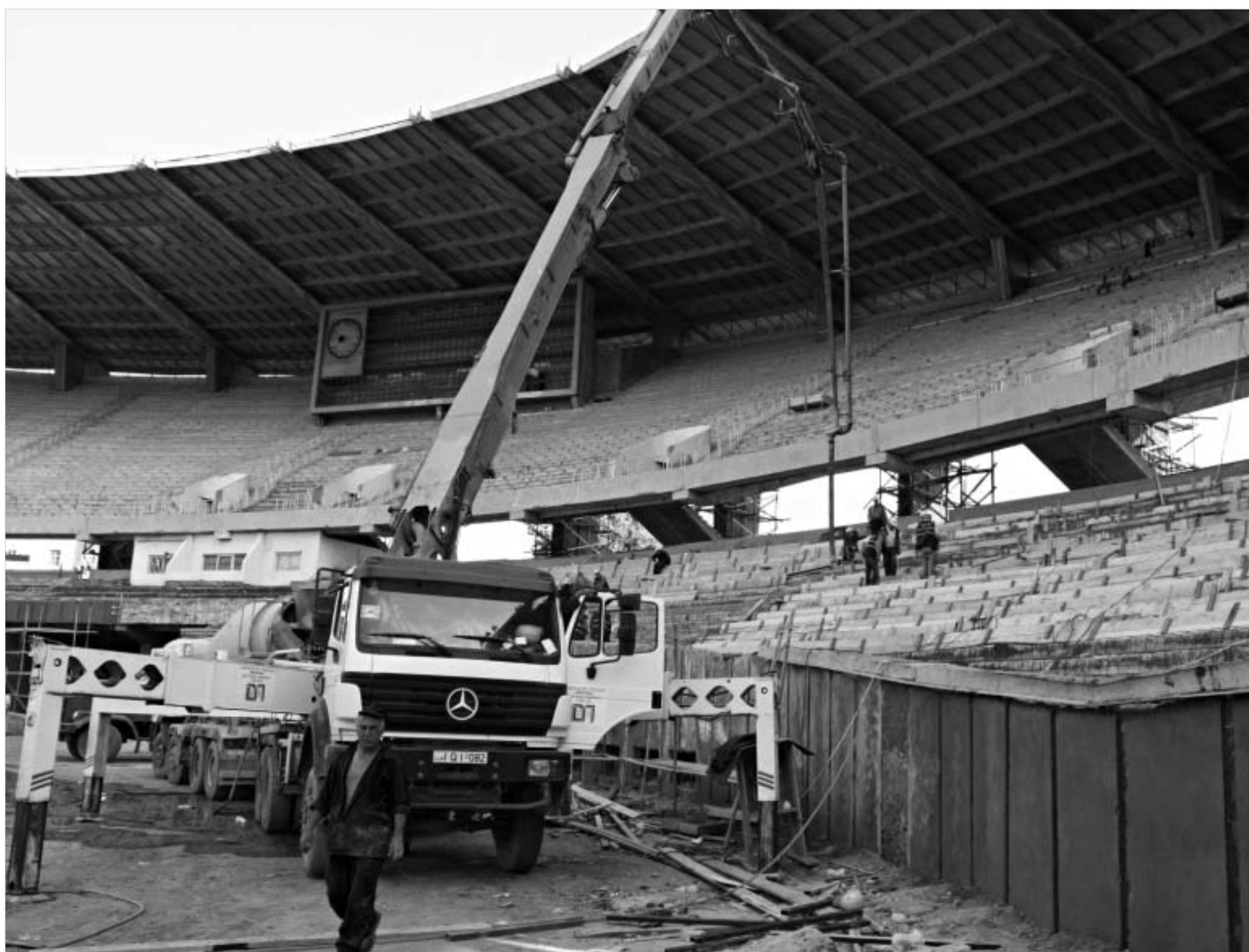
ავისტოს შუა რიცხვებში განახლებული სტადიონი გვექნება.

ეროვნული სტადიონის სამ თვეში აშენებას რა უნდა?