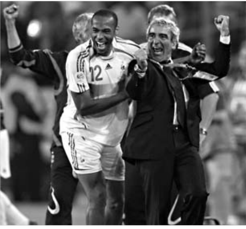
რონალდო რეკორდი ლეგენარულ გერდ მიულერს წაართვა.

ესპანელებთან შთაბეჭდიანი და პრინციპული გამარჯვების შემდეგ რაიმონ დოზანაქის სეგრების წინ მეოთხედფინალში ბრაზილია ელთი. თუმცა, მერვედფინალში მიღწეული წარმატება ფრანგი სპეციალისტისთვის საკმარისი გამოდგა იმისთვის, რომ ნაკრებისთვის ფინალში თამაში დაეასაზოზნა. - მისტერ დოზანაქი, ამჟამად დღევანდელი გამარჯვებით? ჩემი ბიჭების გამარჯვებაში მატჩამდეც ვიყავი დარწმუნებული, რადგან მათ კარგად აქვთ შესწავლილი ესპანელებთან თამაშის მანერა. თამაშისას არსებული რამდენიმე სირთულის მიუხედავად, ჩვენ მაინც ბრწყინვალე გამარჯვება მოვიპოვეთ. ამას კი ესპანელებთან დაძაბულობა დაგვეხმარა. - ფრანკ რიბერიმ მერვედფინალში შესანიშნავი თამაშით დაგამაზახსოვარ თავი მეოთხედფინალშიც ვიხილათ მას მოედანზე?