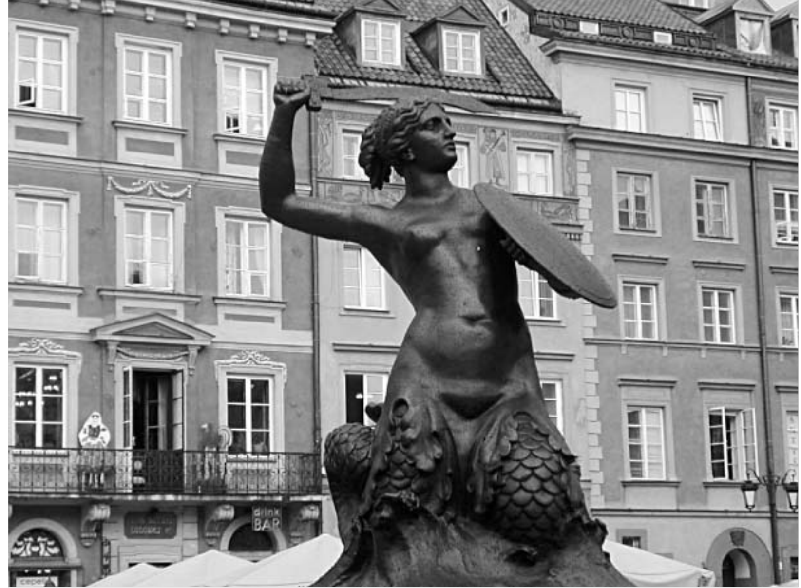
დღევანდელი ვარშავა. განსაკუთრებით მისი ძველი უბანი, ძველი ვარშავის მართალია ზუსტი, მაგრამ მაინც ასლია.

პოლონეთში მოქმედი კანონი კი, როგორც მისი სათავეებიდან ჩანს, ეროვნულ და ეთნიკურ უმცირესობებს ერთმანეთისგან განსხვავებს. ეროვნული უმცირესობის სტატუსი ენიჭება ერს, რომელსაც პოლონეთის გარდა თავისი სახელმწიფოც გააჩნია. მაგალითად უკრაინელები, ბელორუ-