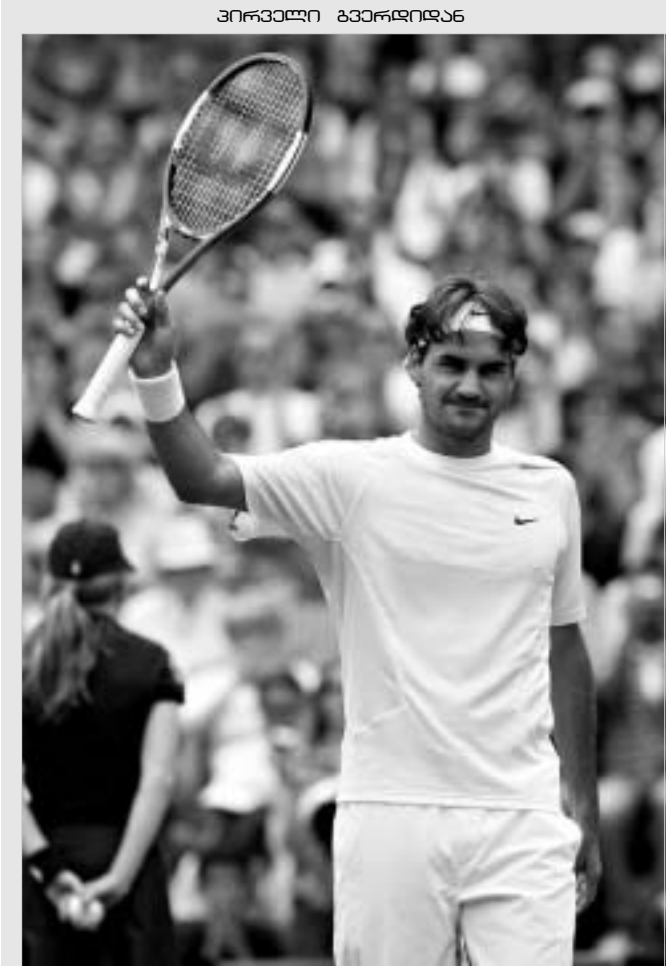
ფედერერის ახალი რეკორდი.

ორშაბათს სტარტი აიღო 2006 წლის უიმბლდონის ტურნირმა. ცხადია, საჩოგბურთო სეზონის მთავარი ტურნირი საფეხბურთო მუნდიალს მაყურებელს ვერ წაართმევს, მაგრამ ლონდონშიც საკმაოდ ბევრი რამ ხდება საინტერესო და ჩოგბურთის გულშემატკივარს, შესაძლოა, ფეხბურთიც კი დაავიწყდეს.