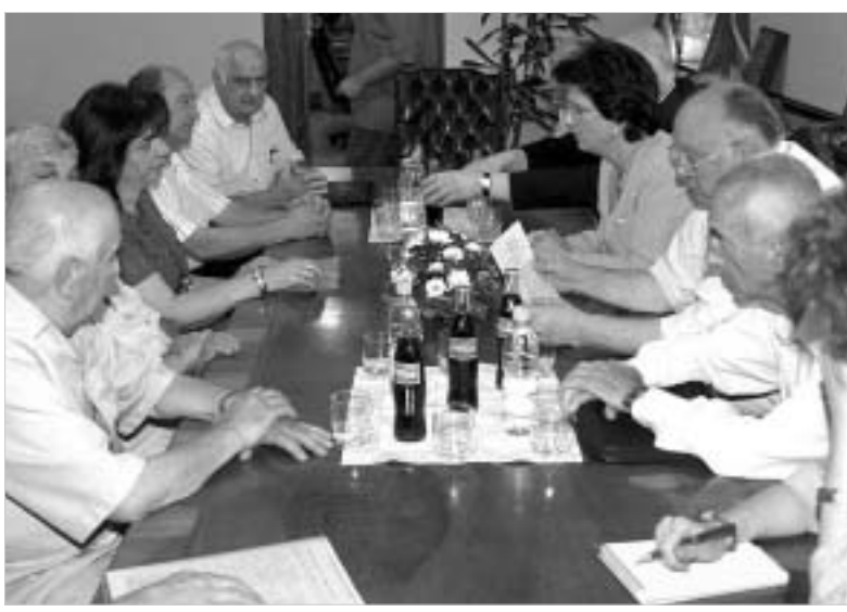
ბურჯანაძის იხიდი აქვთ პროფესორებს

საქართველოს პარლამენტი თბილისის სახელმწიფო უნივერსიტეტის დიდი სამეცნიერო საბჭოს პროფესორებთან კომპრომისზე წავიდა. გუშინ პარლამენტის თავმჯდომარესთან, ნინო ბურჯანაძესთან პროფესორების დახურულ შეხვედრაზე, რომელსაც ფრაქცია "მრეკველებს" თავმჯდომარე ზურაბ ტყეშელაშვილმა და განათლების კომიტეტის თავმჯდომარე ნოდარ გრიგოლაშვილმა ესწრებოდნენ, პარლამენტის თავმჯდომარემ პროფესორებს პირობა მისცა, რომ საკონკურსო კომისიაში მათ წარმომადგენლებს შეიყვანდნენ. შეხვედრის შემდეგ გაორკვა, რომ ასევე გადაიდებდა კონკურსის პირობები, ვადები და ფორმა. გრიგოლაშვილის განცხადებით, პარლამენტის მხრიდან ეს არ არის კომპრომისი, რადგან ნინო ბურჯანაძე და პარლამენტის თავმჯდომარე მიიჩნევენ, რომ კონკურსის შექმნედილია და ის სახელმწიფო უნივერსიტეტში უპირობოდ უნდა ჩატარდეს. ნინო ბურჯანაძის განცხადებით, იგი თბილისის სახელმწიფო უნივერსიტეტის რექტორს, გიორგი ზუბუას საკუთარი ინიციატივით შეხვდა, რათა უნივერსიტეტში არსებული ვითარების შესახებ ინფორმაცია მიეღო. პარლამენტის თავმჯდომარის თქმით, უნივერსიტეტში ვითარება უნდა განიხილებოდა, თუმცა რექტორმა აუცილებლად უნდა გაგრძელებდა და კონკურსები ჩატარდეს. "თავად რეფორმების ჩატარების მომხრენი აღნიშნული პროფესორ-მასწავლებლები არიან, თუმცა მათ უნივერსიტეტში არსებული დონე არ აკმაყოფილებს," - აღნიშნა ნინო ბურჯანაძემ. პარლამენტის თავმჯდომარემ გუშინ პროფესორებს პირობა მისცა, რომ ის კონსულტა-