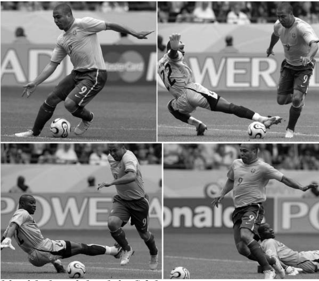
რონალდო რეკორდი ლეგენარულ გერდ მიულერს წაართვა.