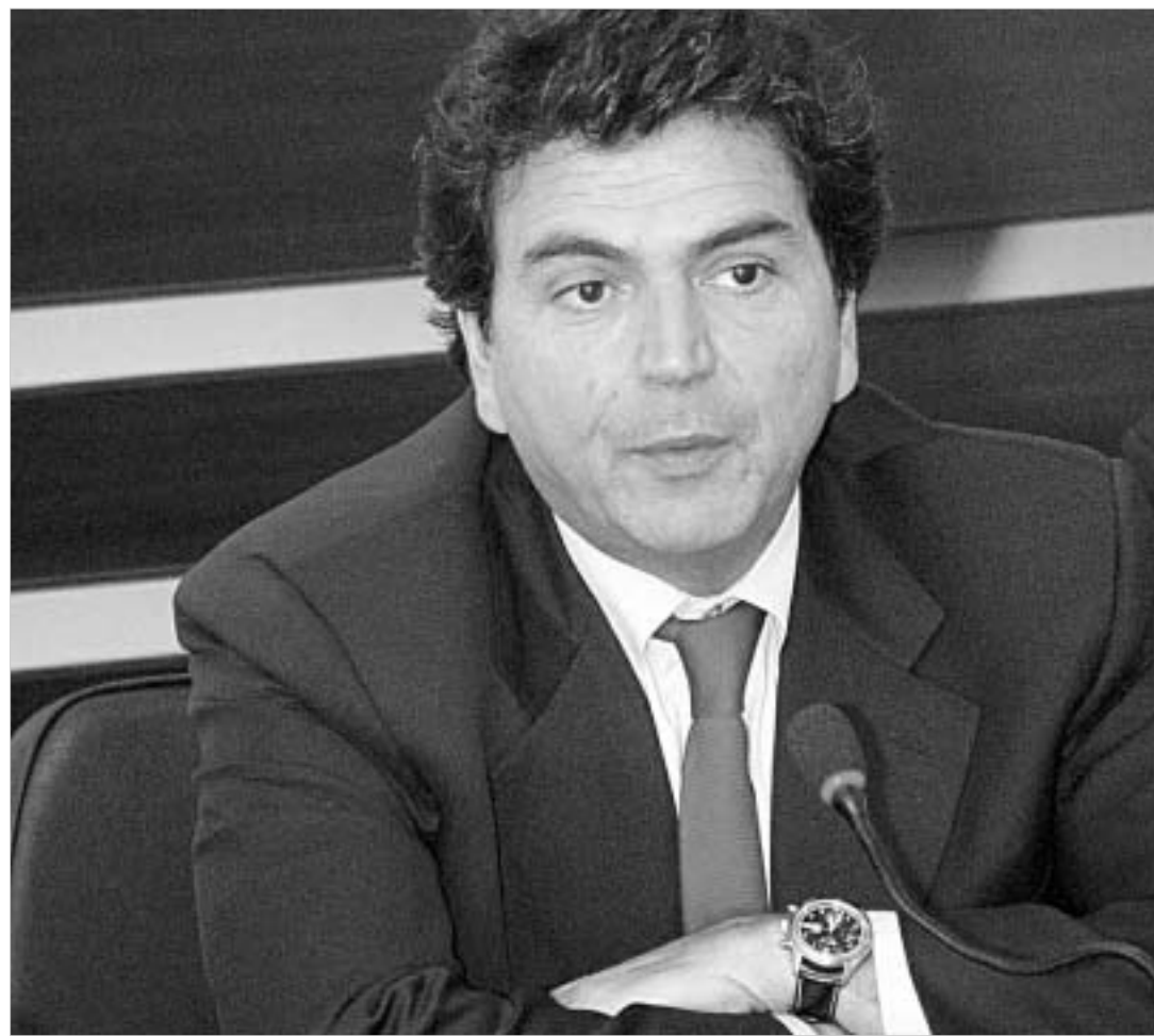
მიერ ლულუშა სეპარატიზმის მხარდაჭერაში რუსეთი დაადანაშაულდა.