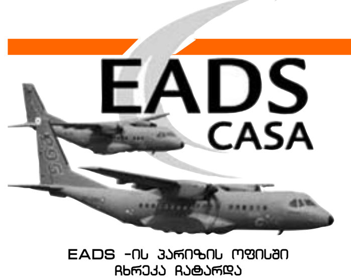
EADS -ის პარიზის ოფისი ჩხრეკა ჩატარდა