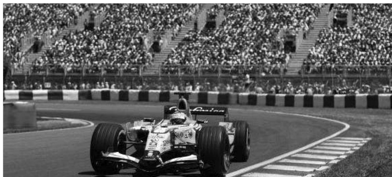
„თელ ვილნევის“ ტრასაზე ბოლდებს ხუთ წელიწადს ეწეებოთ მწვანე შუკი.