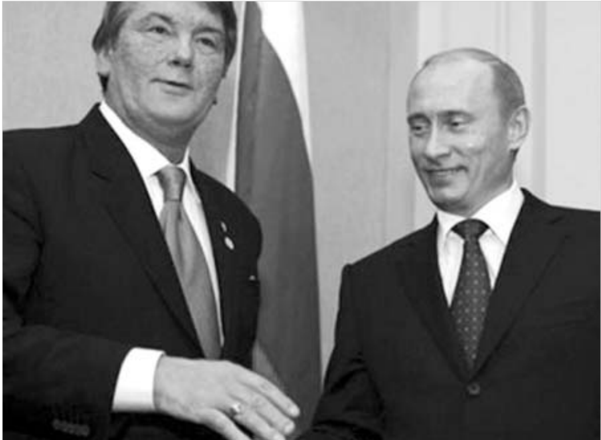
პუტინი და იუშენკო ერთმანეთს ირმუნებენ. რომ მიღწეული შეთანხმებით ყველა კმაყოფილი იქნება.

იუშენკო კი კვლავაც (ცილიობს, გაფანტოს ეჭვები 4 იანვრის შეთანხმების გარემოში. "უკრაინა არ გადაუხვევს არც ერთ ასოს, როგორც რუსეთთან, ას-