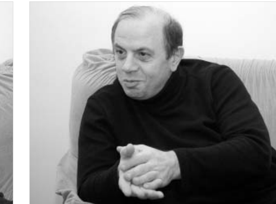
აბაჩიძეა B2 გავრცედა