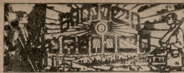
საქართველის ავტონომიური რესპუბლიკის