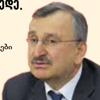
იხილეთ მე-3 გვერდზე

„ლარის მკვეთრი რყევები არასტაბილურობის განცდას ქმნის“