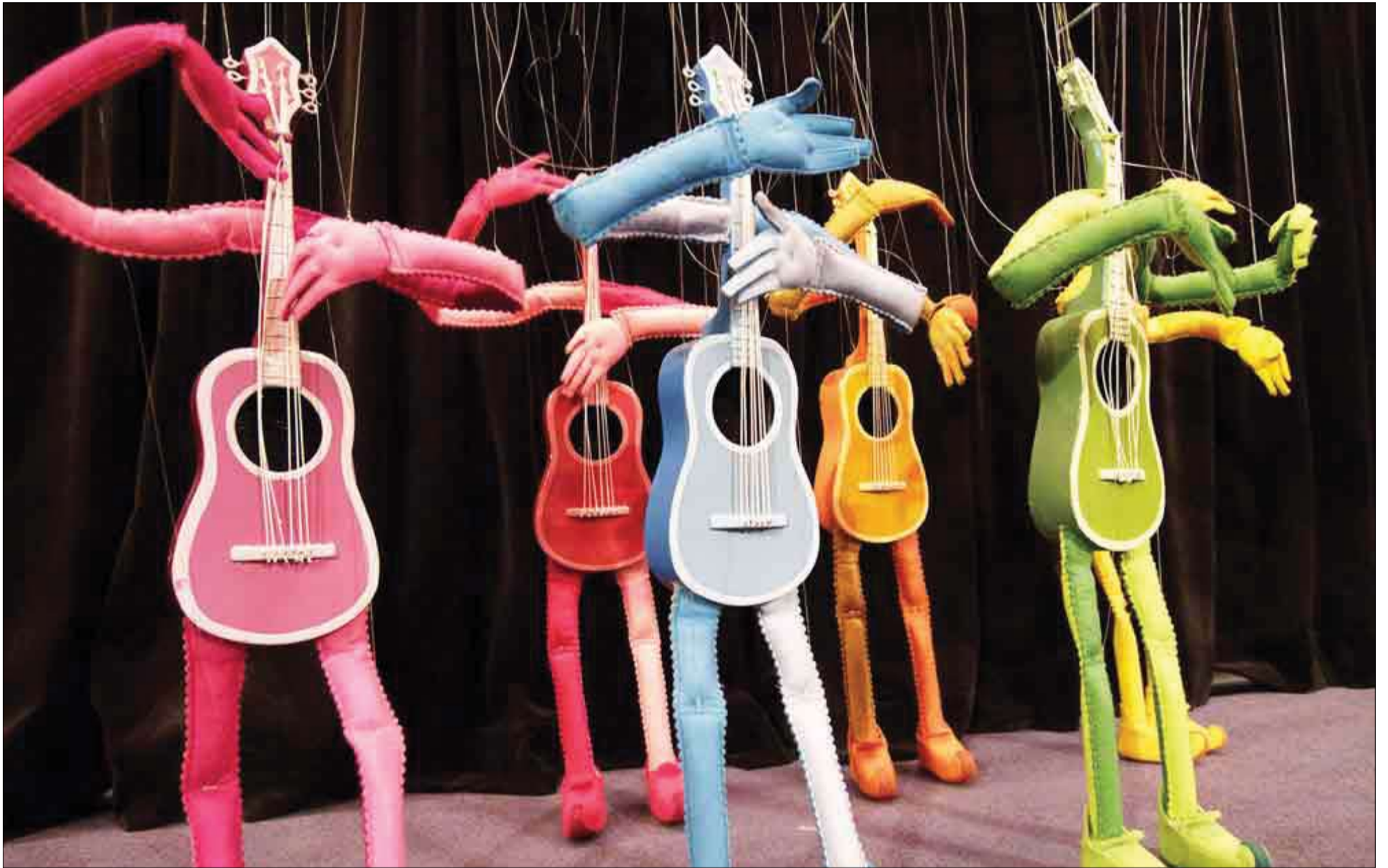
იხილეთ მე-3 გვერდზე