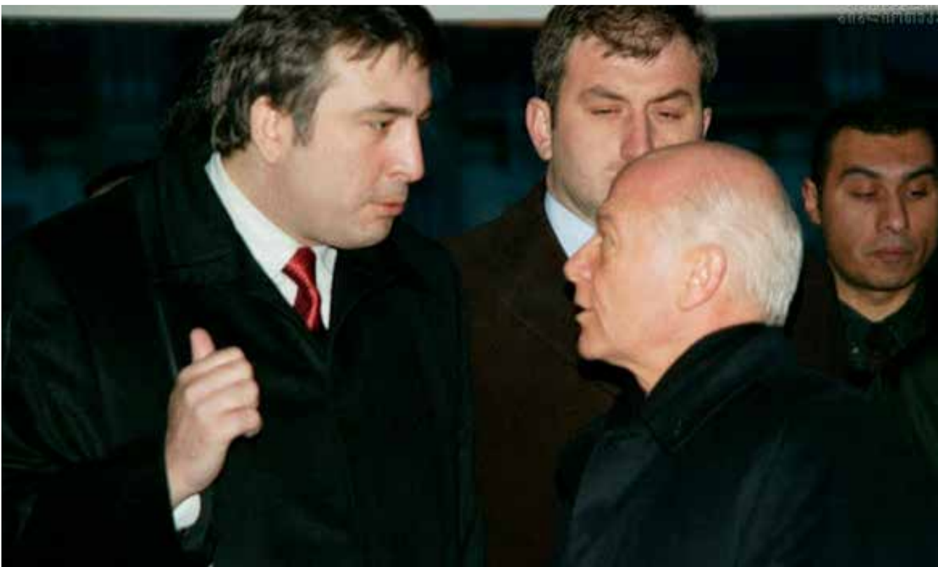
სისხლიანი რებუსი – პოლიტიკური გიორგობის X-ფაილი

„მიუხედავად იმისა, რომ ბათუმში ბევრს აღიზიანებდა აბაშიძისადმი დუმბაძის, ერთი შეხედვით, ძალღერძი ერთგულება, მიაჩნიათ, რომ ეს იყო არა მონური, არამედ, იძულებითი ქმედება. როდესაც აბაშიძის მითითებით,