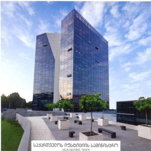
საქართველოს იუსტიციის საბინის ფოტო 2013 წლის