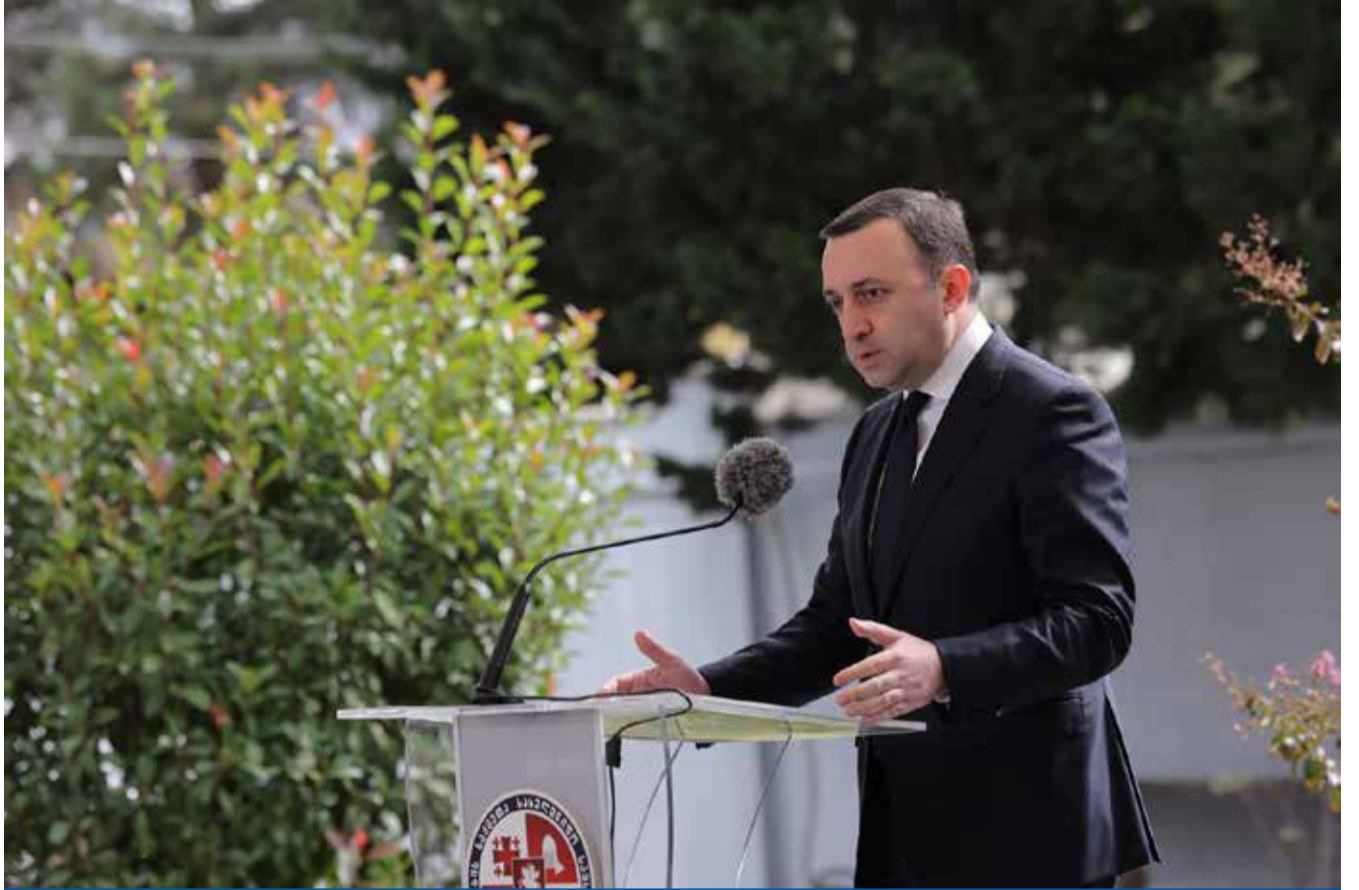
ირაკლი ლარიბაშვილი ვეტერანებისთვის საპენსიო სისტემის დარეგულირებას იწყებს

„რამდენიმე შემთხვევაში გავიხსენო და ჩამოვთვალო. იცით, რომ დაახლოებით, ათი წლის წინ, ვეტერანებისთვის არ არსებობდა საყოველთაო დაზღვევის თუნდაც მინიმალური პაკეტიც კი. ჩვენ დღეს შეიძლება ამაცად ვთქვათ, რომ სახელმწიფო, მთავრობა, 125 მილიონ ლარს ხარჯავს იმისთვის, რომ ყველა ვეტერანის დაზღვევა იყოს დაფინანსებული მთავრობის მიერ. ამის გარდა, რა თქმა უნდა, დაახლოებით, 40 მილიონი ლარი იხარჯება ომში მონაწილე ვეტერანების ყოველთვიურ კომპენსაციაზე; დაახლოებით, 25 მილიონი ლარი იხარჯება სხვადასხვა სერვისისთვის. ასევე, მინდა