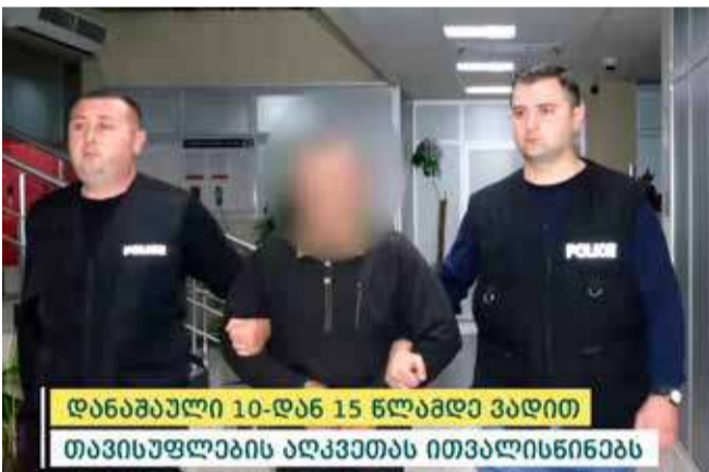
დანაშაული 10-დან 15 წლამდე ვადით თავისუფლების აღკვეთას ითვალისწინებს

სამართალდამცველებმა ჩატარებული საგამოძიებო მოქმედებების შედეგად ბრალდებული ცხელ კვალზე დააკავეს. პოლიციამ დანაშაულის ჩადენის იარაღი ნივთმტკიცებად ამოიღო. განზრახ მკვლელობის ფაქტზე გამოძიება საქართველოს სისხლის სამართლის კოდექსის 108-ე მუხლით მიმდინარეობს.