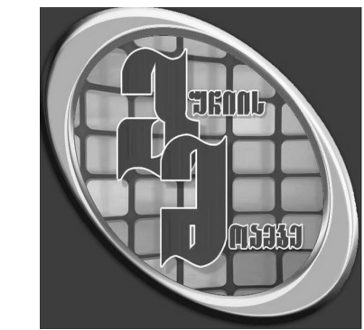
სწორი აგრარული პოლიტიკა, გამოცდილებაზე დაყრდნობილი პოზიციონირება ამ სფეროში და

მონი კულტურების – მარტო ჩაის, მარტო თხილის, მარტო მოცვის მოყვანის წინააღმდეგე ვარ, აი, როცა შენ გაქვს მოცვის პლანტაცია, მას უამრავი დაგადება უტევს მაშინ როცა მოცვის გვერდით არ „ჰყავს ისეთი მეგობრები“ რომლების ამ დარტყმას შეუმუშებებ და ნაწილს საკუთარ თავზე აიღებენ. აი, მაგალითად თხილს რა გავუკეთოთ? გავხადოთ მონი კულტურა, ამოუძირკვეთ ყველაფერი ირგვლივ და დაეჭოვოთ ამ შემოტყვებთან მარტო. და მვედოთ ის, რაც მვედოთ, ეს კულტურა უკვე განსაკუთრებულ ყურადღებას ითხოვს, იმ დონითაც კი, რომ, მისი მომსახურება საბაზრო ფასს უკვე ჩამოუვარდება. ვლუგები დღეს თხილის პლანტაციების შესაწყობად რომ ძვირად, ხუმრობენ და ამბობენ, რომ შესაწყობად კი არა მოსაწყობად ძვირად“ – მიიჩნევენ