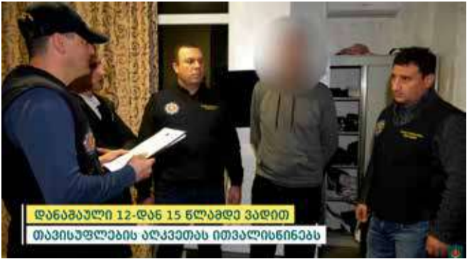
დანაშაული 12-დან 15 წლამდე ვადით თავისუფლების აღკვეთას ითვალისწინებს

გამოძიება საქართველოს სისხლის სამართლის კოდექსის 143-ე პრიმა მუხლის მეორე და მესამე ნაწილით მიმდინარეობს, რაც ორი ან მეტი პირის მიმართ ადამიანით ვაჭრობას გულისხმობს.