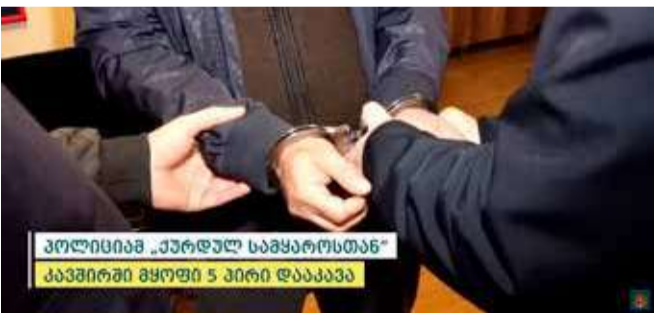
პოლიციამ „ქურდულ სამყაროსთან“ კავშირში მყოფი 5 პირი დააკავა

აღნიშნული დავის გადასაწყვეტად, ქალაქ ბათუმში, ე.წ. ქურდული გარჩევა მოაწყვეს, სადაც კრიმინალურმა ავტორიტეტმა კომპანიის ერთ-ერთ დამფუძნებელს განუცხადა, რომ დავაში ჩართული იყო „კანონიერი ქურდი“ და საკითხი „ქურდული სამყაროს“ წესების შესაბამისად უნდა გადაწყვეტილიყო. კომპანიის ერთ-ერთ მენილეს ბრალდებულები ფიზიკურად გაუსწორდნენ და სიცოცხლის მოსპობის მუქარით, 75 000 აშშ დოლარის გადახდა დააკისრეს.