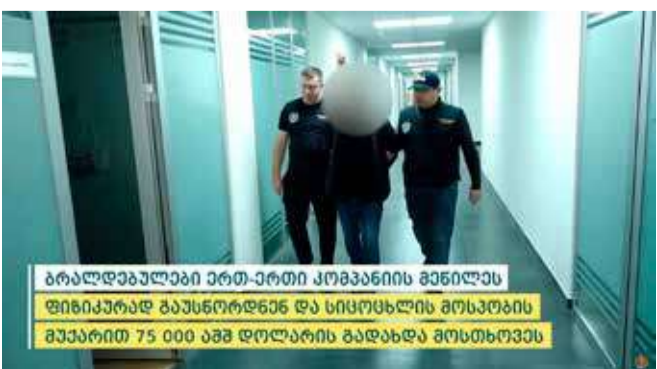
ბრალდებულთა ერთ-ერთი კომპანიის მენილეს ფიზიკურად გაუსწორდნენ და სიცოცხლის მოსპობის მუქარით 75 000 აშშ დოლარის გადახდა მოსთხოვეს

გ.ა. - ახლა რაც შეხება ამ თანხასთან დაკავშირებით ძაბ, მე ხუთი „ბანაბი“ ვალდებულება ძაბ, მე რასაც ვაბაბო, იმ აბრაბა არიან ისინი.