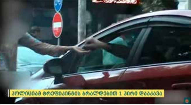
პოლიციამ ტრეფიკინგის ბრალდებით 1 პირი დააკავა

შინაგან საქმეთა სამინისტროს ცენტრალური კრიმინალური პოლიციის დეპარტამენტის ორგანიზებულ დანაშაულთან ბრძოლის მთავარი სამმართველოს ტრეფიკინგისა და უკანონო მიგრაციის წინააღმდეგ ბრძოლის სამმართველოს თანამშრომლებმა, ოპერატიული და საგამოძიებო მოქმედებების შედეგად, ტრეფიკინგის ბრალდებით, წარსულში ნასამართლევნი, 1975 წელს დაბადებული ვ.ა. დააკავეს.