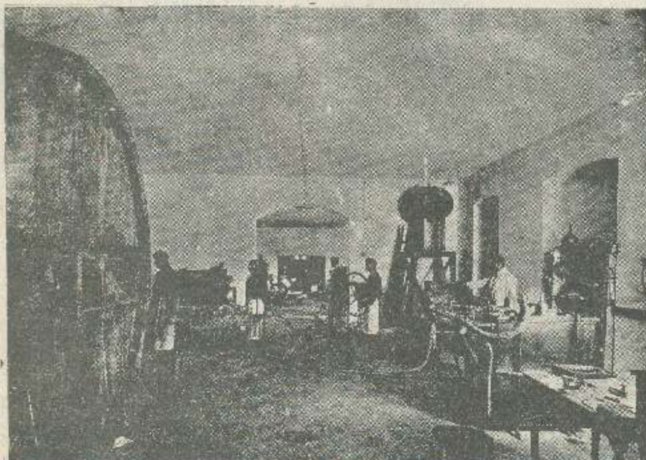
სარდაფი „კახეთისა“: ღვინის გათავსება-გადმოღობა

საზოგადოებას აქვს განყოფილებანი: ბაქოში, ასხაბადში, ტაშკენტში, ბათუმში, მოსკოვში, არმავირში, ლექსანდროპოლში, ეკატერინოდარში.