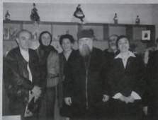
მასპინძლისთან ერთად ანგელოზი.