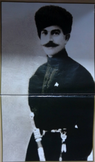
ქაქუცა ჩოლოყაშვილი 1924 წლის აჯანყების მეთაური