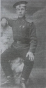
რევაზ ჩხეიძე — როსტომ იტრიალის პორტრეტი

სამი თვე თავისებურ ნორმად მკვიდრდებოდა მის ცხოვრებაში.