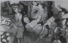
მხატვარი გიგა შალამიძელი

- დაბნ, - ხმაილდა უპასუხა ოსარიანმა, - ეს ლეიტე- ნენტი დახმარია.