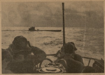
ბერძანული მშენებლობის შემოსახარის მხრის ატლანტიკის ოკეანეში.

1911 წ. შედგინდა იყო 4 მდიანი 200 ათასი გუბერნატორი კონსტიტუცია 1930 წლიდან შედგინდა გარჯანა 100 ათასი. ნიხანდობის რატვის გადაცემის გადაღება ნაციონალიზმი საშუალო წინააღმდეგობა 7 წყარო, იგი მოღწევს 194.