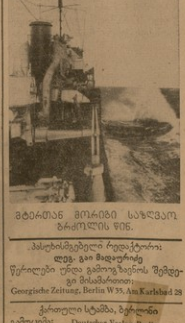
ბერძანული მშენებლობის შემოსახარის მხრის ატლანტიკის ოკეანეში.