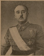
ფრანკ მას იყო ოფიცერი, ოჯახში ტრადიციული მიხედვით, ის როგორც ყველა მისმა შვიკმა ფრანკოზე თავის პიროვნებაში არიბი სამხედრო საქმე.

1917 წელს მას შინაომი ომების ხარისხი და ნებაყოფილობით წავიდა სამხედრო სამსახურში ესპანეთის მართვაში. მისი სამსახურ და ყოველწლიური მისი, თავიდანვე ის შექმნის ჯარის ყავად, რომელიც გამოქვეყნდა იყო ფრანკო-სპანეთის ომის და ერთგულებით საფრანგო სამხედრო სამსახურში მსოფიერად აღიარებულ დარჩა იგი დღემდეამდ.