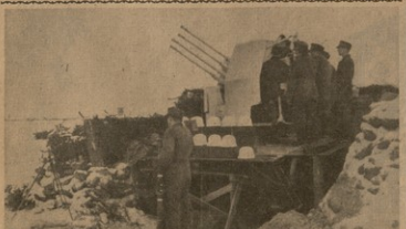
აღმოსავლეთის ფრონტში, ბიკაბანდო სახინთრო ბატალიონი

იაპონიის თეთიფრთხიანების შებენილის გეგმის ჩიტყვნის მსხვილად თავს დასვა მჭრის ქორავსი, რომელიც 40 სტანამპორტი გერმანიის შედეგობრივად ჩინოვის მიხედვით ერთი ციკლიზმი და 5 დასველება გეგმის მოქმედებით სამხედრო საზღვაო და იარაღის მიმართვის ფართო მსხვილად აღსანიშნავი იტალიის მიხედვით. იაპონიის თეთიფრთხიანების მხიედ დასაბუთება მჭრის 8 გეგმ.