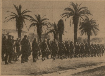
მთავრობის წარმომადგენელი ბრუნებულნი

მისი მეთაურობით უმჯობესად იბრძოდნენ. მისი მეთაურობით უმჯობესად იბრძოდნენ. მისი მეთაურობით უმჯობესად იბრძოდნენ.