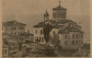
ფინია ბანიგოლის ამთხვარაღარი ბაზარი.

ამავდროულად სიკეთეობის ის ცენტრ იმერეთისა და უკეთეს ახალ სახალხო ანტონოვი გამოვლინება. ის გამოვლინდა რუსეთის მეტად ძვირი დაუგდა რუსებს შესცეს მეფის მეტადობა. იგი მოთხოვნი ხოლომონ, თავდადებული ბინისაგან მეფე ვაჭრობის სოლომონი ახერხებს ვაჭრობის მთელი ოსმალეთში.