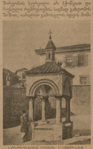
სლოვაკი მგორის სახელი.