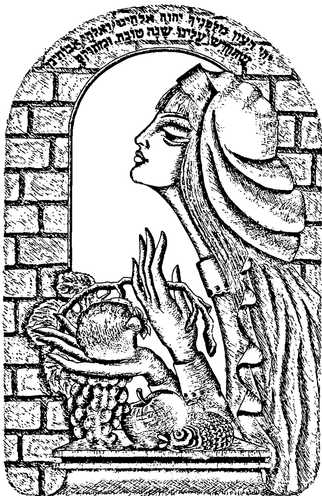
"იყო ნება შენი, უფალი ღმერთო ჩვენი მამებოცხვ, რომ ვანგეიასლევ პღნიერი ღო ჯკპილი ახალი ჩელი!"