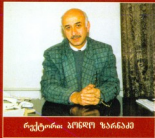
დირექტორი: ბენედიქტო ზანინაძე