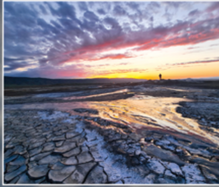
თანთი-თეფა (თანახის ვუღანაი)