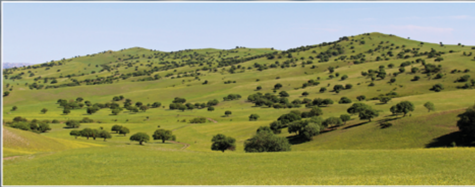
საქმონსინანი ნათილი ტყე