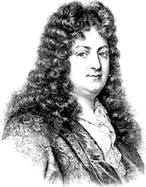
ჟან ბატისტ რასინი (1639-1699)