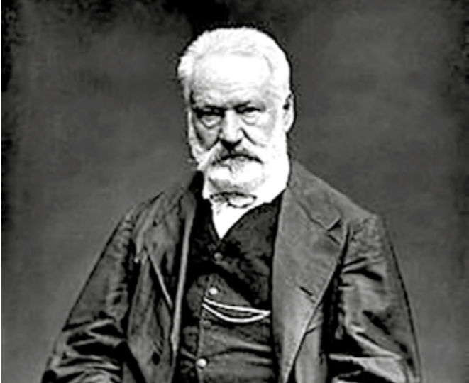
ვიქტორ ჰიუკო (1802-1882)

მთაო წმინდაო... და ხეობებო, სასწაულებით გამორჩეულო! მშობელო მხარევე წინაპრებისა, ტკბილ სამშობლოზე ვწუხვართ შვილები, ნუთუ ყოველთვის ასე ვიქნებით – ჩვენი ქვეყნიდან განდევნილები?...“