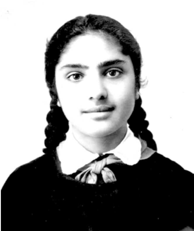
წარჩინებულ მოსწავლეთა დაფიდან