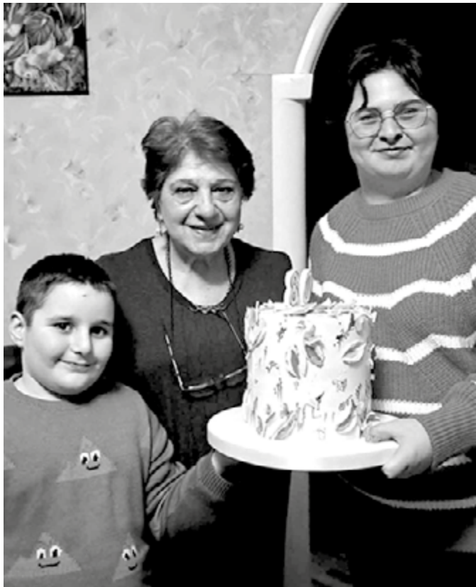
მე, გიორგი და ნია (შვილიშვილები)

რად გამიმეტე ასე, დედილო, ვით განიზრახე ჩემი ღალატი? სირცხვილით ვის გსურს გააგებინო, რომ შეიღს ჩააცვი მგონის ხალათი? შენ ცისფერ ეტლებს მიმეც მსახურად, მიფრთხობენ სიზმრებს შლეგა ქარები, მე თაფზე ეკლის ჯიდა მახურავს და შეშლილს მიგავს სმირად თვალები. რად გამიმეტე ასე, დედილო, ჩემგან რა წყენა მოგაგონდება? ჩემს ტვინში ახლაც ლექსი ნებივრობს და, იცი, ტანჯვა მიახლოვდება. რად გამიმეტე ასე, დედილო, მოგეცა ჩემთვის ნიჭი მეგუთნის. იცი თუ არა, დედავ, დედილო, რომ თავი ჩემი მე არ მეკუთვნის, რომ ლექსს დავყავარ უმისამართოდ, აკკვრივარ ქალაქს შხერადადლილი, რომ ეს ცხოვრება მე ვერ გამართობს და მომკლავს სადღაც ქუჩის ძაღლივით. რად გამიმეტე ასე, დედილო, ვით განიზრახე ჩემი ღალატი, სირცხვილით ვის გსურს გააგებინო, რომ შეიღს ჩამაცვი მგონის ხალათი.