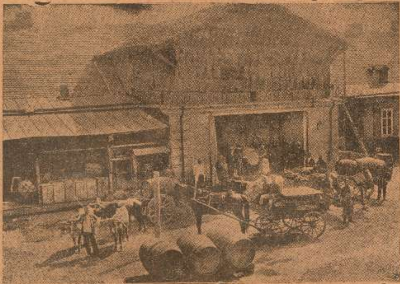
ეზო საზოგადოება „კახეთისა“: ღვინის მოტანა და გატანა

საზოგადოებას 15 წლის განმავლობაში ტრავუყილია 1,000,000 ვედრო ღვინო 3,000,000 მან.