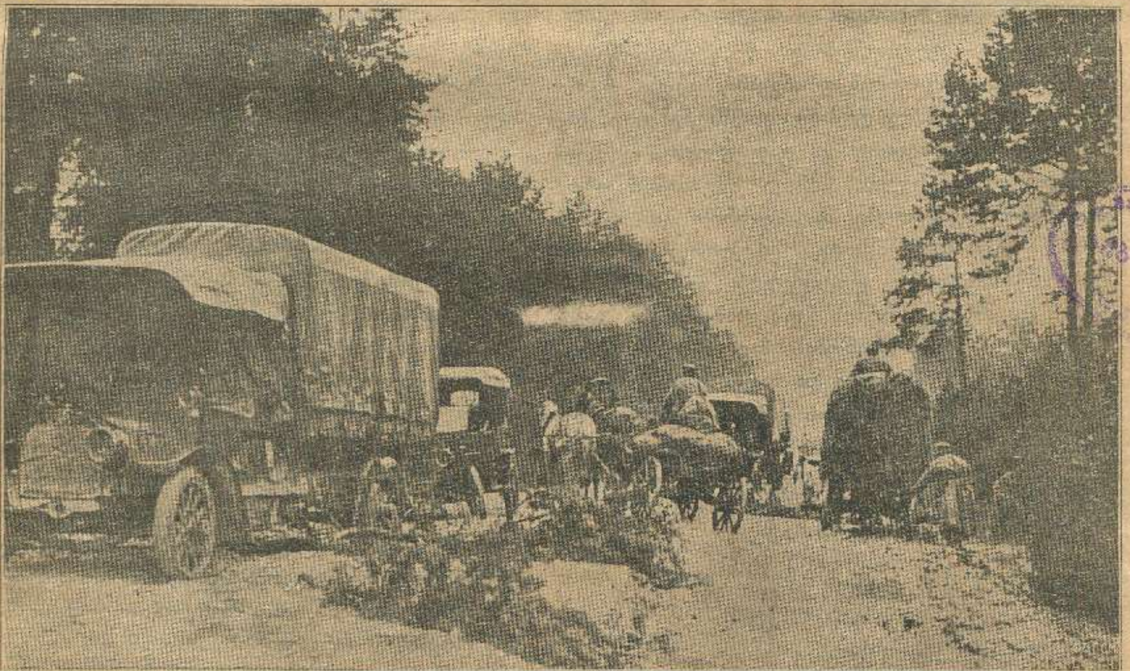
გერმანელებისაგან გაფუჭებული, გზა პოლონეთის ასპარეზზედ.