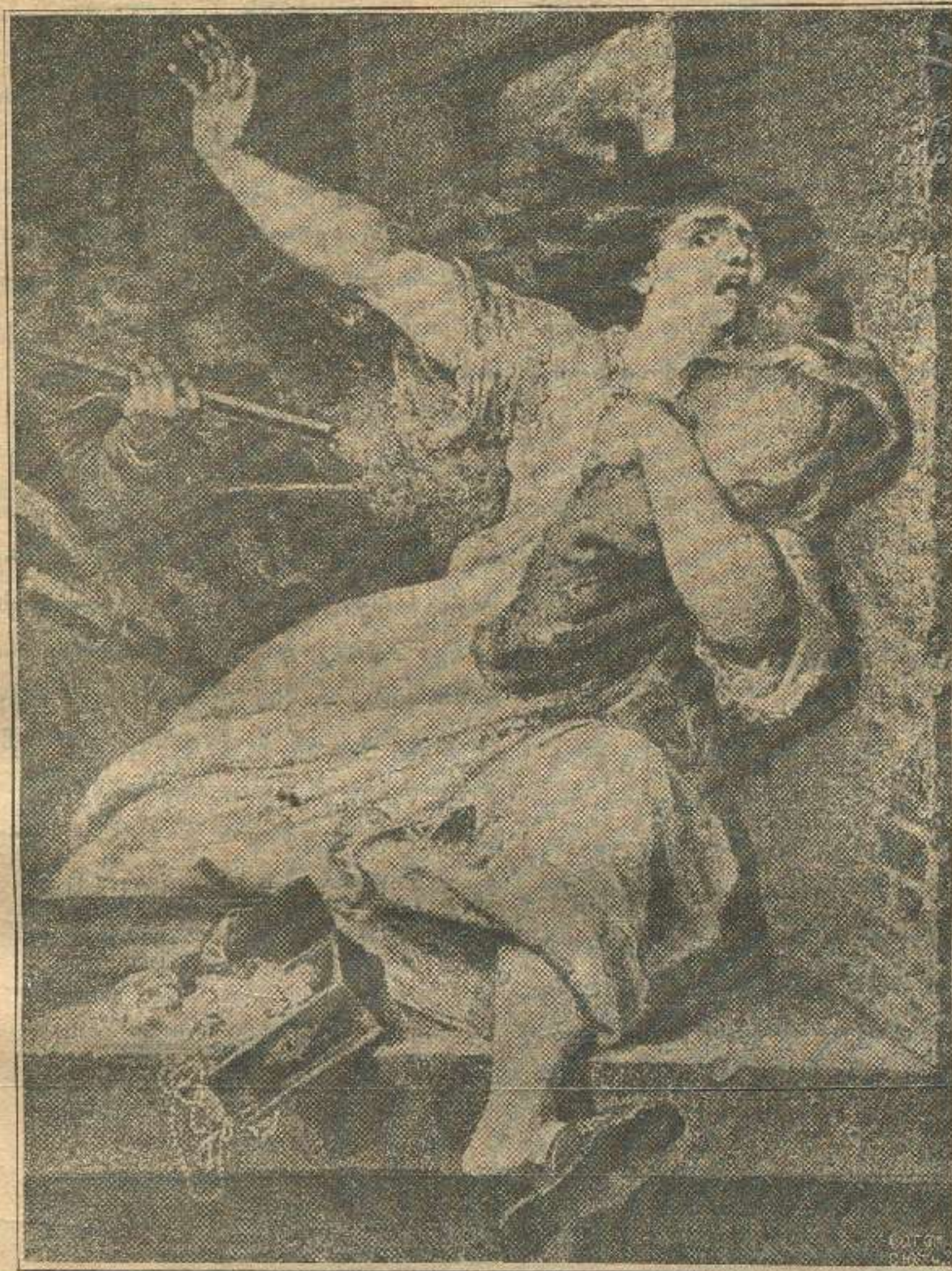
„შეცნიერების დაპყრობანი“ (ვირტი 1806—1865).

ეს ბრძოლა არსებობისათვის ომამდის, ვიდრე პირობები უკოტად თუ ბევრად ნორმალური იყო — არ მწვაფდებოდა უკიდურესობამდის, რადგან თანდათანობითი იყო, მაგრამ დღეს როდესაც ერთის მხრით ომმა ძირიან-ფესვიანად ააფორიაქა მთელი წყობილება ცხოვრებისა, როდესაც ერთბაშად მუშა გაღარბდა ერთი ორად (რაკი სამუშაო ქირა არ გადიდდა და ცხოვრება კი გაძვირდა ერთი ორად) და მეორეს მხრით ასიათასთავიანი ტალღა გამოქცეულთა ერთბაშად დასცემს სამუშაო ქირას თვისი უხვი მიწოდებით სამუშაო ძალისა, — დღეს, ჩვენის