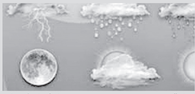
ნალექიანი ამინდისა და დაბალი ტემპერატურის შენარჩუნებას სინოპტიკოსები კვირის ბოლომდე პროგნოზირებენ.

დღეს დასავლეთ საქართველოში გამოიდარებს, თუმცა აღმოსავლეთ საქართველოში ნალექი შენარჩუნდება. გარემოს ეროვნული სააგენტოს ინფორმაციით, დასავლეთ საქართველოში დღე უნალექოდ ჩაივლის, იქროლებს აღმოსავლეთის ქარი 10-15, ზოგან კი 20-25 მეტრი/წამში. დაბლობში 18-23 გრადუსი სითბო დაფიქსირდება, მთაში 15-20, ხოლო მაღალ მთაში 9-14. აღმოსავლეთ საქართველოს უმეტეს რეგიონში ხვალ წვიმა მოსალოდნელი. სინოპტიკოსები კახეთში ძლიერ ნალექსა და ნისლს პროგნოზირებენ, მაღალმთიან რეგიონებში კი თოვლქაბაა მოსალოდნელი. აქაც დაუბერავს აღმოსავლეთის ქარი 10-15, გორი-სურამის მონაკვეთზე კი 17-22 მეტრი/წამში. დაბლობში ტემპერატურა 10-15 გრადუსამდე დაიწვეს, მთაში 13-18 გრადუსს გაუტოლდება, მაღალ მთაში 5-10, ჩრდილო მაღალმთიან რეგიონებში კი 0-5 გრადუსი დაფიქსირდება. სინოპტიკოსების ცნობით, ხვალ თბილისშიც მოსალოდნელია წვიმა და ნისლი. აქაც დაუბერავს სამხრეთ-აღმოსავლეთის ქარი 8-13 მეტრი/წამში. ტემპერატურა 13 გრადუსამდე დაეცემა.