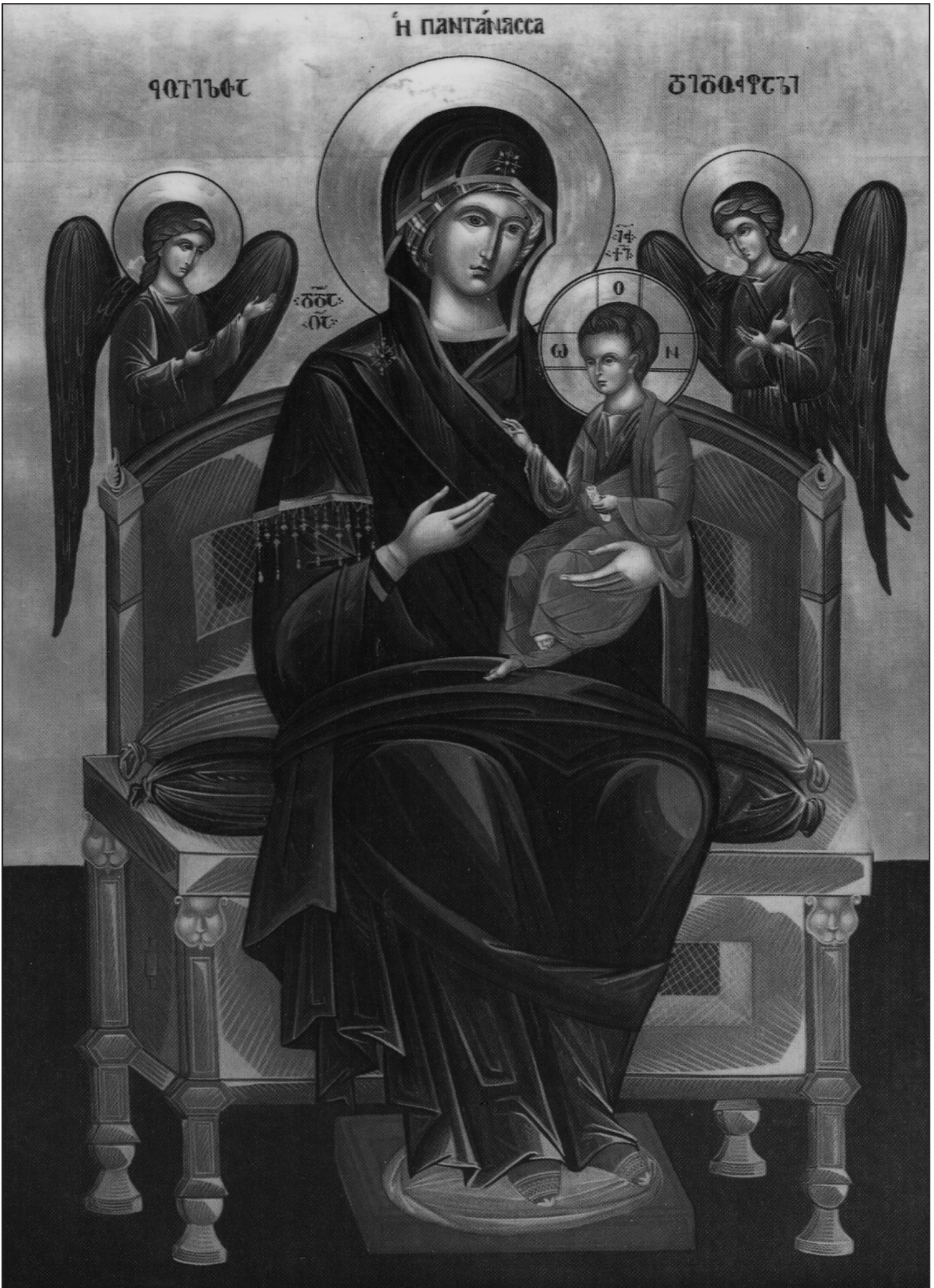
ყველას გუარევედეთ მადლი ღვთისმშობლისა და მაცხოვრისა.