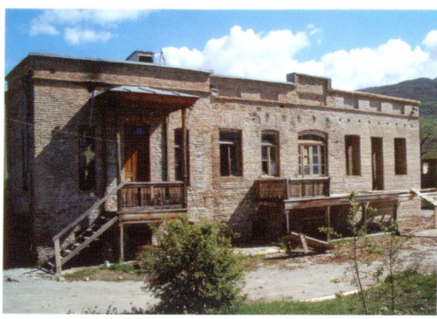
ივანე მარაბელის უბიტიფიკა

„ბავრი რამ ხდება, ჰორაციო, მათა და ქვეყნად, რაც ფილოსოფოსთ არც აი დასიზარებათ...“ შექსპირი - „ჰამლეტი“