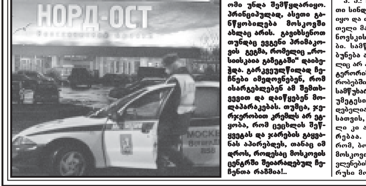
რუსეთის სპეცსაზი. რუსეთის სპეცსაზი.