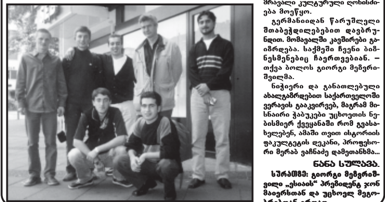
საერთაშორისო კავშირების განვითარების მიზნით საქართველოს მთავრობის წარმომადგენლები გერმანიის კავშირის მნიშვნელობას ხაზს უსვამენ.

ბმწმ (გერმანია) არის საქართველოს ახალი საერთაშორისო პარტნიორი. ეს არის ერთ-ერთი უდიდესი და მნიშვნელოვანი საერთაშორისო კავშირი საქართველოსთვის. გერმანიის კავშირი საქართველოსთვის არის მნიშვნელოვანი საერთაშორისო პარტნიორი. ეს არის ერთ-ერთი უდიდესი და მნიშვნელოვანი საერთაშორისო კავშირი საქართველოსთვის. გერმანიის კავშირი საქართველოსთვის არის მნიშვნელოვანი საერთაშორისო პარტნიორი. ეს არის ერთ-ერთი უდიდესი და მნიშვნელოვანი საერთაშორისო კავშირი საქართველოსთვის.