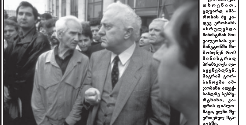
გორბაჩოვის თხოვნით, ელჩად ამბროსის ძე კიდე...

ნათყვანა ლონიძის მიხედვით „საბარკო სამართა მინისტრები - რეპრეზენტატივი და უნიკალური“