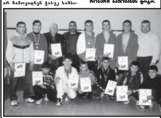
სამგოს პრეზიდენტის მხარდაჭერით...