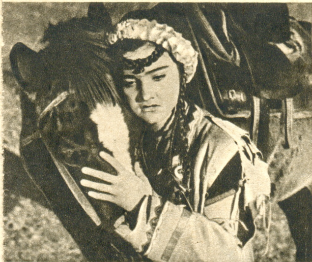
«Золотой тропой» Л. Абашидзе — Юрта