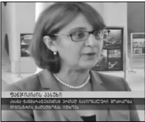
ფანჯიკიძის კანონი კანონ-ნაწარმოებულს უკმაყოფილო მოქალაქეებს შინაპროცესის განხორციელება

„ჩვენ არ ვაპირებთ სხვა ალიანსებისკენ სწრაფვას, გარდა ევროკავშირისა და ნატოს“, — აღიარა პრესკონფერენციაზე საქართველოს საგარეო საქმეთა მინისტრმა მიაია ფანჯიკიძემ, რომელიც ერთდღიანი ვიზიტით ლატვიაში იმყოფებოდა. „ჩვენ უნდა მივსდეთ ქართველი ხალხის ნებას, რომელიც მხარს უჭერს ინტეგრაციას ევროკავშირსა და ნატოში“, — დაუმატა მინისტრმა.