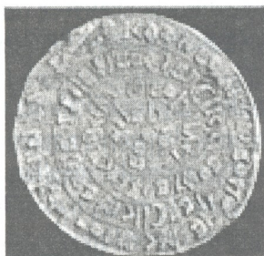
A - მხარე