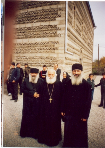
ეპისკოპოსი ექვთიმე (ლეჟავა), დეკანოზი შალვა ( შუბითიძე), ეპისკოპოსი ლუკა (ლომიძე)