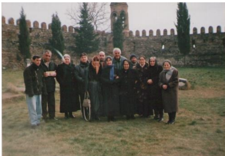
მამა შალას მრევლი წილკანში