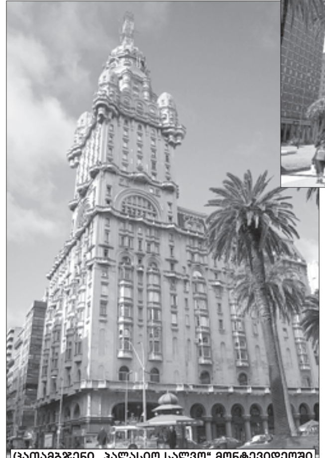
კათალიკური „პალასიო სალვო“ მონტევიდეოში