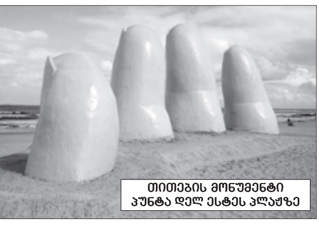
თითავის მონუმენტი პუნტა დელ ესტან პლაჟზე

ქვეყნის სახელწოდება წარმოდგება მდინარე ურუგვაის სახელიდან და ადგილობრივი ინდოელების ენაზე ნიშნავს მდინარეს.