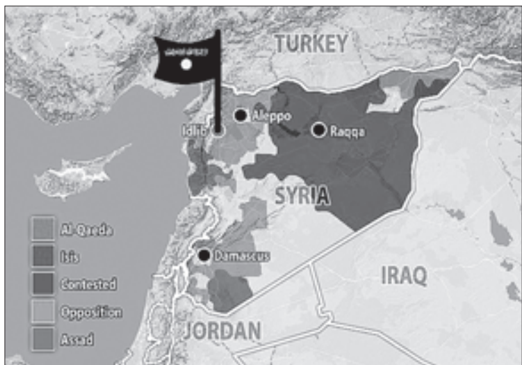
ტერიტორიები, რომლებსაც ისლამისტები აკონტროლებენ

ბიორბი ბაჩილიაქა, მომზადდა საინფორმაციო სააგენტო „რეგნუსის“ ვებგვერდზე გამოქვეყნებული მასალების მიხედვით