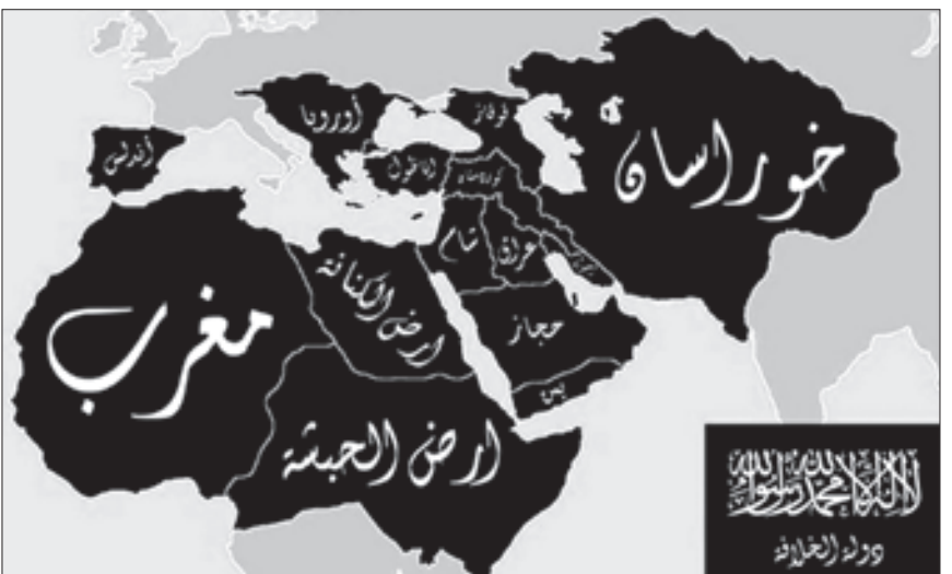
აი, რას უშიზნებს „ისლამური სახელმწიფო“