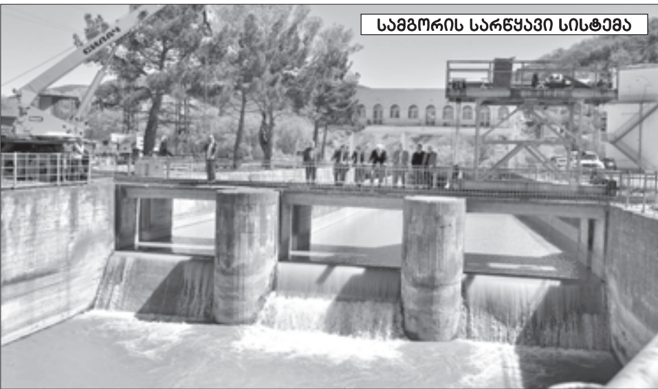
სამგორის სარწყავი სისტემა

აღმოსავლეთ ამიერკავკასიის მორწყვის პროექტის ერთ-ერთ ნაწილს შეადგენდა სამგორის სარწყავი სისტემა, რომელიც ითვალისწინებდა ორის წყლით მლაშე ტბების შევსებას და სასმელი წყლით ქალაქის მომარაგებას, ხოლო წყალსაცავში ჩასვლამდე — წყლის სარწყავად გამოყენებას.