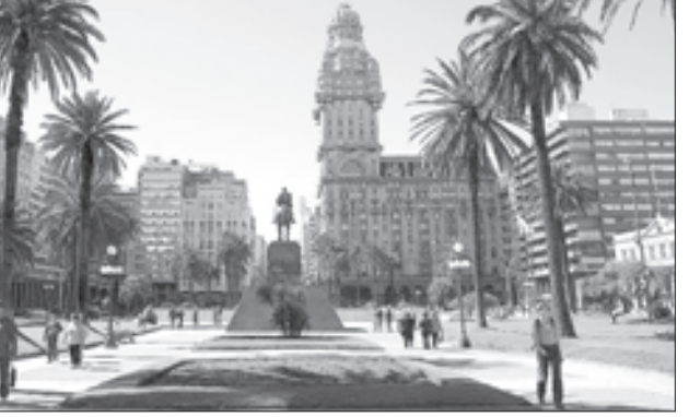
თავისუფლების მოედანი მონტევიდეოში