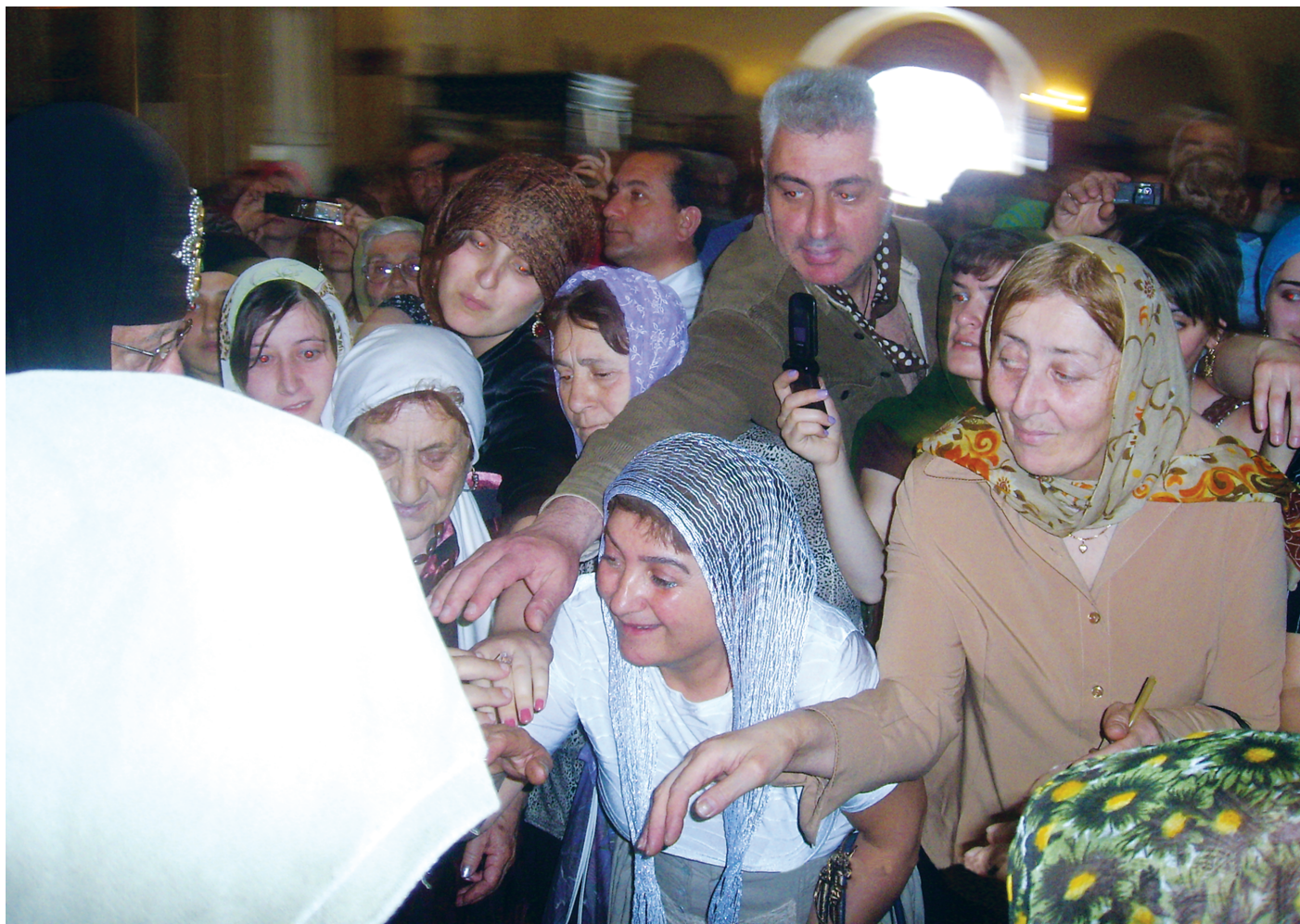
სამება. წმ. სვიმონ კანანელის ხსენების დღე