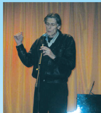
დედაენის დღისადმი მიძღვნილი საღამო