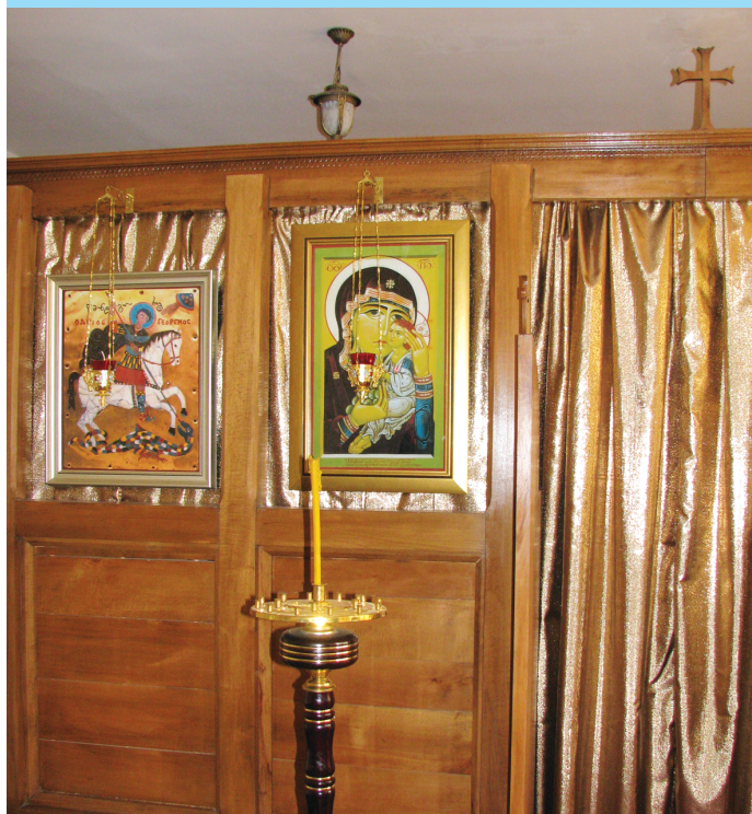
ბიბლიის ოთახი სოხუმის უნივერსიტეტში