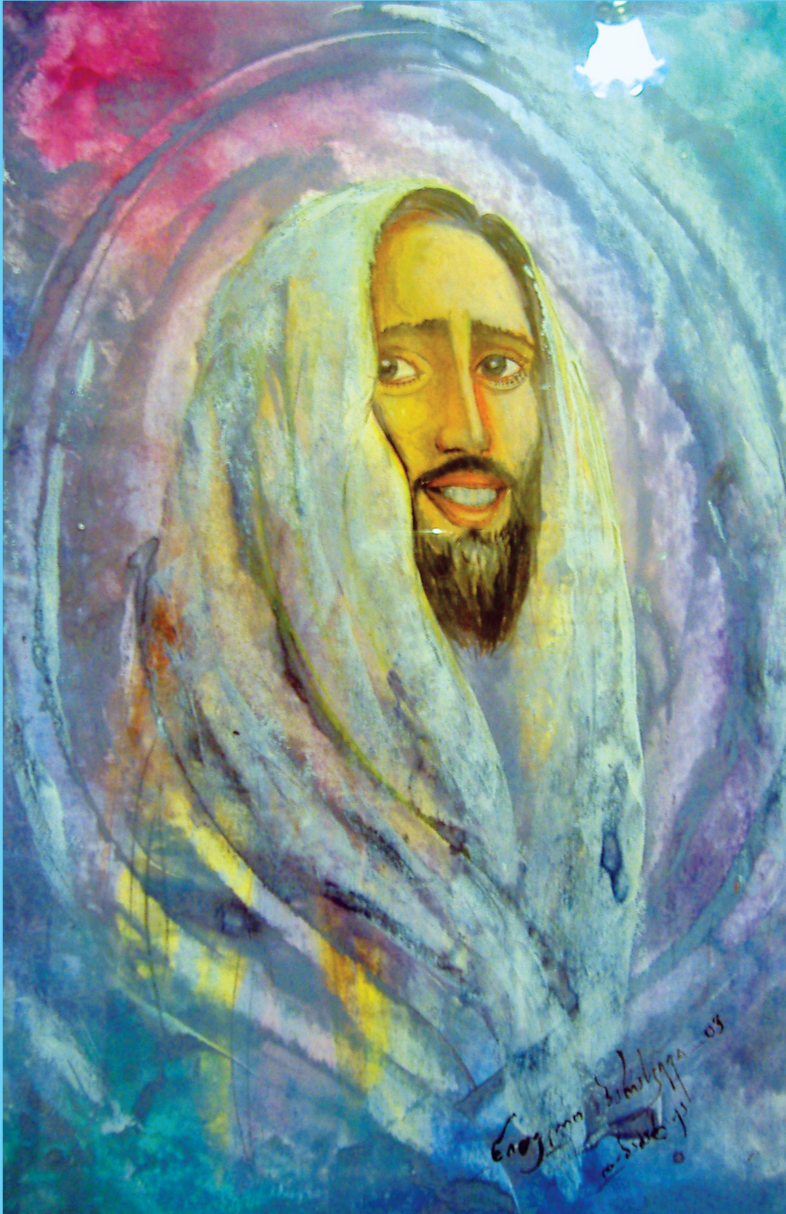
დავით ბაძაღვა. "იესო". 2008

სარედაქციო კოლეგია: სვეტლანა ქეცბა, დეკანოზი ბიძინა (გუნია), ლია სეხნიაშვილი, ალექსანდრე ფარფალია, ირინა ქეცბა პასუხისმგებელი რედაქტორი ციცილო ჯულუხიძე