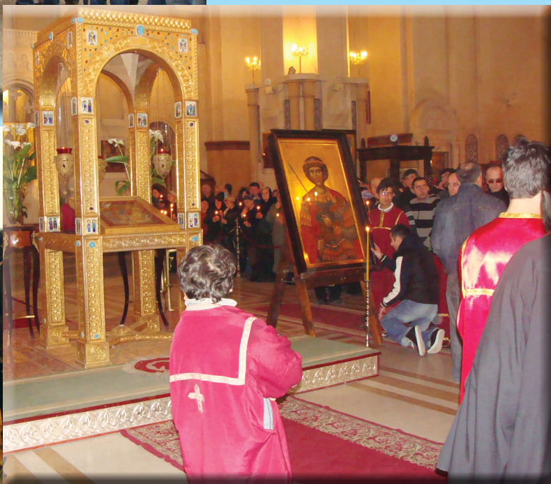
ბიულეტენი გამოდის ცხუმ-აფხაზეთის მიტროპოლიტ დანიელის (დათუაშვილის) ლოცვა-კურთხევით 2007 წლის ივლისიდან