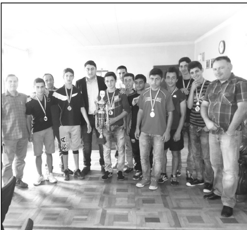
ქ. ბათუმში, ბახვის საფეხბურთო სკოლის აღსაზრდელებმა (2003-2004 წწ.) ჯანი ცივაძის სახელობის ტურნირზე მე-3 ადგილი