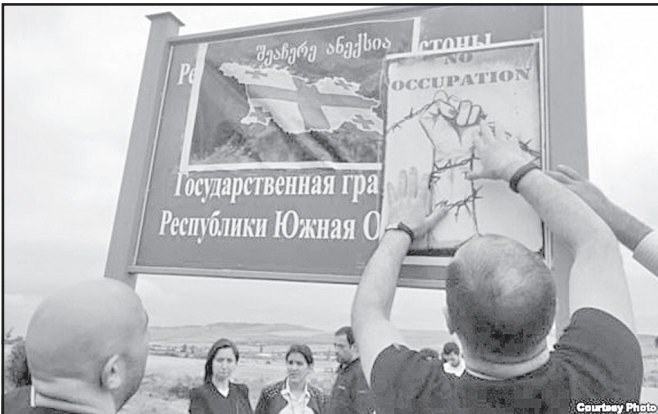
საქართველოს მთავრობის განცხადებით, რუსმა მესაზღვრეებმა დააყენეს ახალი სასაზღვრო საცნობი ნიშნები ოსეთის რესპუბლიკის ტერიტორიაზე.

ყურნალისტების, ოპოზიციონერებისა და აქტივისტების ნაწილი, რომლებმაც გადანაცვალეს ადგილზე გაეპროტესტებინათ დე ფაქტო სამხრეთი ოსეთის რესპუბლიკის, ახალი საცნობი ნიშნების გაჩენა, რომლებიც დააყენეს რუსმა მესაზღვრეებმა სოფლებში ხურვალეთი და ნითელუბანი, იდგამდნენ წინააღმდეგობაში. „არა-ოკუპაციას!“ ზოგიერთს ნერვებმა უმტყუნა და მათ მოხსნეს ბანერები. ქართველ პოლიციელებს წინააღმდეგობა არ გაუწევიათ აქტივისტებისათვის, საბედნიეროდ, არ გამოჩნებულან არც რუსი მესაზღვრეები. მთელი ალბათობით მათ გადანაცვალეს თვალყური ედევნებთ მომხდარის შესახებ შორიდან.