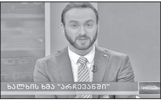
ხალხის ხმა „არჩევანში“

წლებში ხუთშაბათობების მოწყობა დაიწყო. შეგვკრებდა ჩუღურეთში, თავის სახლში ძველ მეგობრებს, ბებიათაძინის, ქალბატონ ანეტას ნამზით, მუხის საუკუნუნახვერიან კარდას ოთახის ერთი კუთხიდან მეორეში გადაგვატანებდა, შემდეგ სუფრას გაშლიდა და „ხუთშაბათობასაც“ აღნიშნავდა. ასე გრძელდებოდა რამდენიმე წელიწადს, თითქმის ყოველ მეორე ხუთშაბათს. გამიკვირდა ორიოდე დღის წინათ რომ დამირეკა და მითხრა, ჩვენი დღესასწაული აღვადგინე და სამშაბათს საღამოს მეწვიეო. გამიკვირდა, რადგან ჩვენი „ხუთშაბათობების“ გადავიდე ანეტა ბებოს კარადა კარგა ხნის დაშლილი იყო და ჩემს მეგობარს არათუ მისი რესტავრაციის, „ხუთშაბათობების“ ძირითადი და მთავარი მიზეზის — ქვიფის ფულიც აღარ ჰქონდა. თანაც ისეთი სახელი დაურქმევია თავისი შაბათობისთვის, რომ გამეცინა. „დედააკვნესებულთა“ დღე უნდა აღვნიშნოთ. მისი ენის პატრონი, ვიცოდი საითკენ უმიზნებდა. ნაცების ცხრანლიანმა ბოგინმა ისე გამწარა არამარტო ჩემი მეგობარი, არამედ მთელი საქართველო, რომ მათ მისამართით ათასგვარ ტერმინს ხმარობდა — „დედააკვნესებულთა“, „დედა არღინები“, „დე-