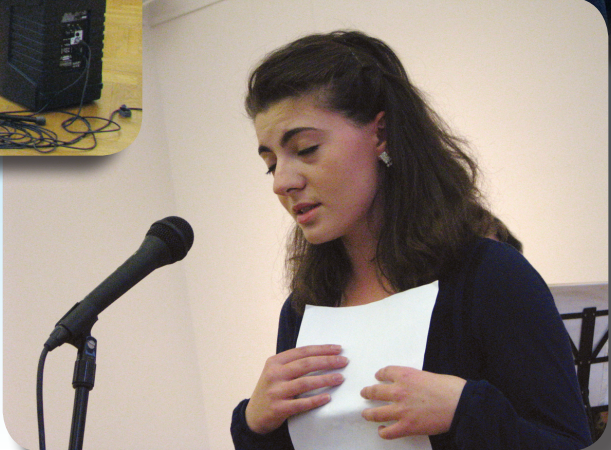
ბიულეტენი გამოდის ცხუმ-აფხაზეთის მიტროპოლიტ დანიელის (დათუაშვილის) ლოცვა-კურთხევით 2007 წლის ივლისიდან