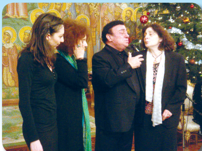
ბიულეტენი გამოდის ცხუმ-აფხაზეთის მიტროპოლიტ დანიელის (დათუაშვილის) ლოცვა-კურთხევით 2007 წლის ივლისიდან