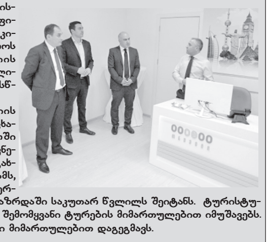
საერთაშორისო მოგზაურების რაოდენობის გაზრდაში საკუთარ წვლილს შეიტანს. ტურისტული სააგენტო „08 თრეველი“ გამყვანი და შემომყვანი ტურების მიმართულებით იმუშავებს.

რომში ტურიზმის ეროვნული ადმინისტრაციიდან იტყობინებიან, სააგენტოს ოფიციალურ გახსნას საქართველოს ეკონომიკისა და მდგრადი განვითარების სამინისტროს ტურიზმის ეროვნული ადმინისტრაციის ხელმძღვანელი გიორგი ჩოგოვაძე და თბილისის ვიცე-მერი დიმიტრი ქუციაშვილი დაესწრნენ.