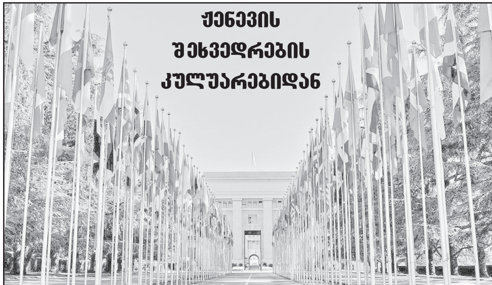
ქენავის უხევედრების კულუარებიდან

რა ხდება ქენევაში მოლაპარაკების მაგიდასთან, რამდენად რბილია თავად რუსეთის ტონი, ან რატომ ვერ ვიღებთ სასურველ შედეგს?