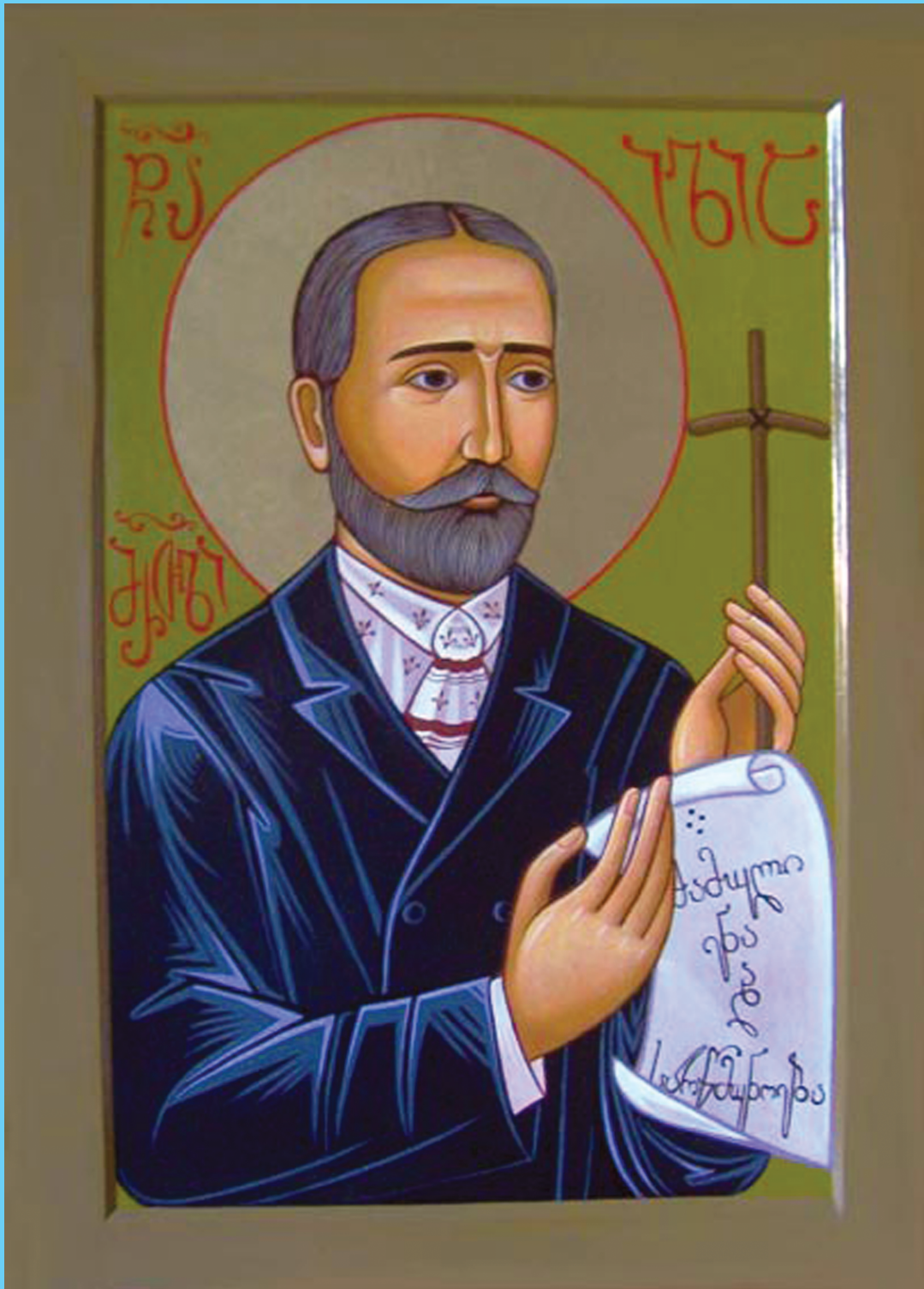
წმ. იოანე მანთონაო (ჩხატასაძე)