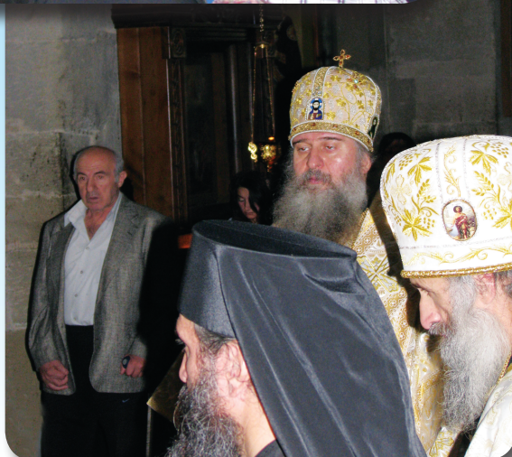
ბიულეტენი გამოდის ცხუმ-აფხაზეთის მიტროპოლიტ დანიელის (დათუაშვილის) ლოცვა-კურთხევით 2007 წლის ივლისიდან