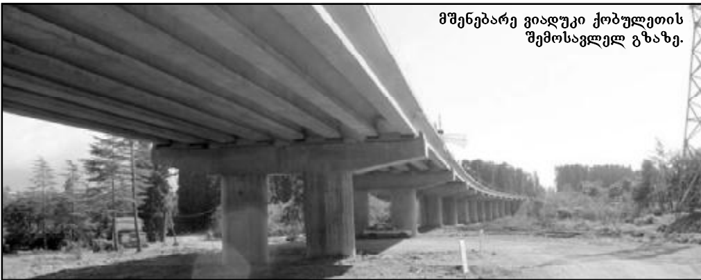
მშენებარე ვიადუკი ქობულეთის შემოსავლელ გზაზე.

საპარტიო ქალაქი და მშენებელი საინჟინრო-საგზაო მომსახურების ორგანიზაციის მმართველი, საპარტიო უფროსი ვაჟაგაძე