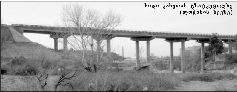
ხიდი კახეთის გზატკეცილზე (ლოჭინის ხეობა)