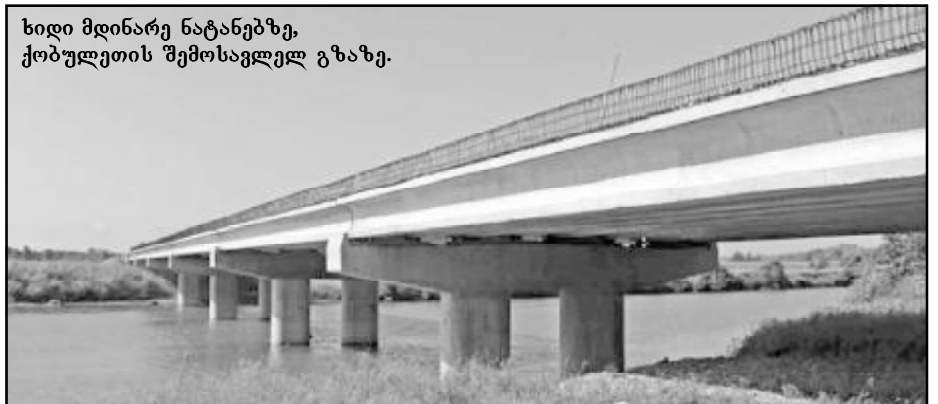
ხიდი მდინარე ნატანებზე, ქობულეთის შემოსავლელ გზაზე.