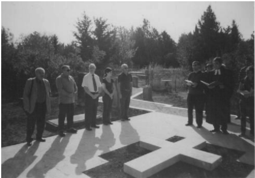
სართიჭალა. მემორიალის გახსნა შვაბთა სასაფლაოზე