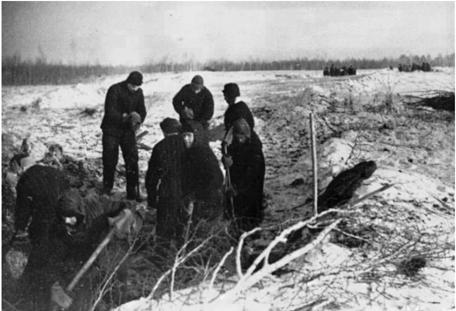
ყაზახეთი. შვაბების მიერ მინაში ხეხილის დაფლვა (გამოსაზამთრებლად)