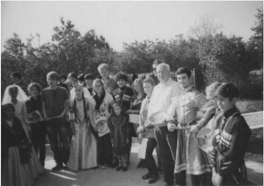
ჰომბურგელები და სართიჭალელები