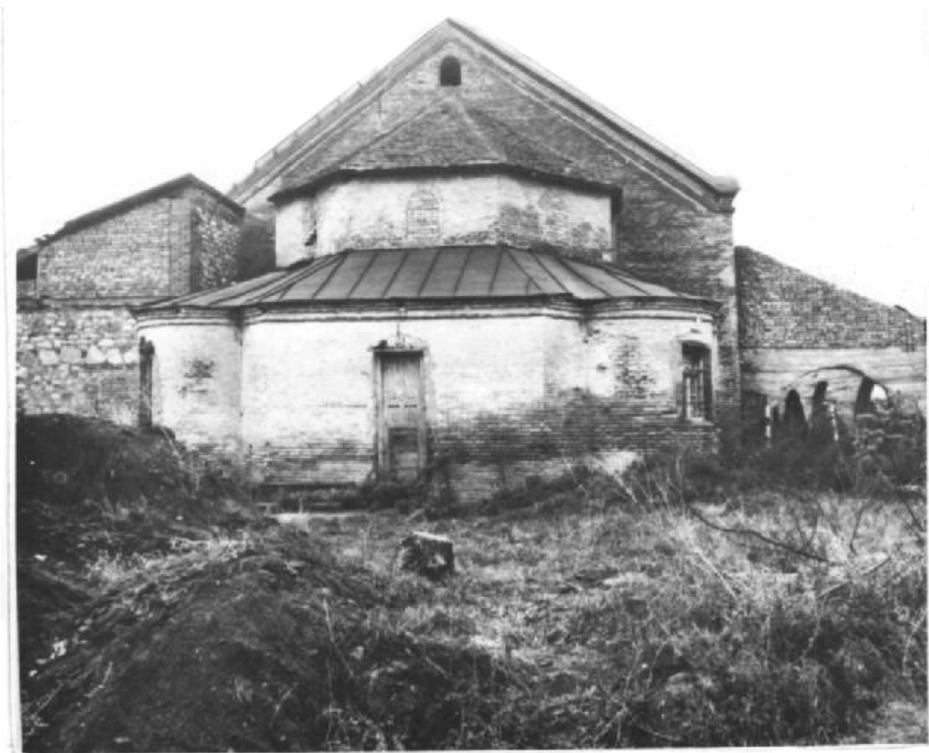
სართიჭალა. ევანგელიურ-ლუთერანული ეკლესიის საკურთხეველი. ამჟამად აქ კულტურის სახლია განთავსებული