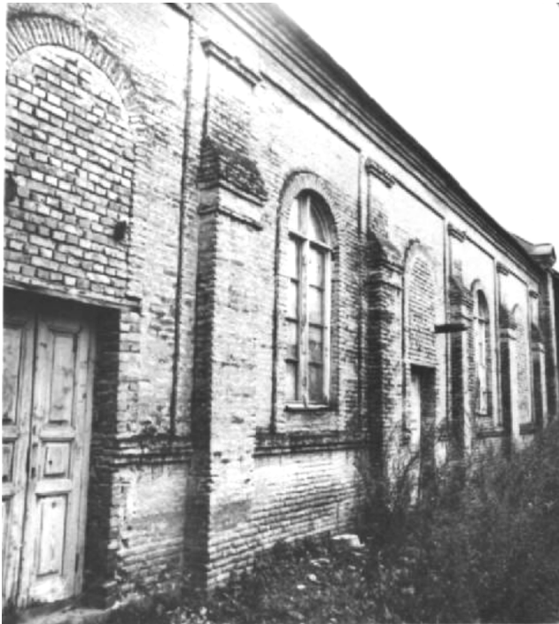
სართიჭალა. ევანგელიურ- ლუთერანული ეკლესიის კედელი.