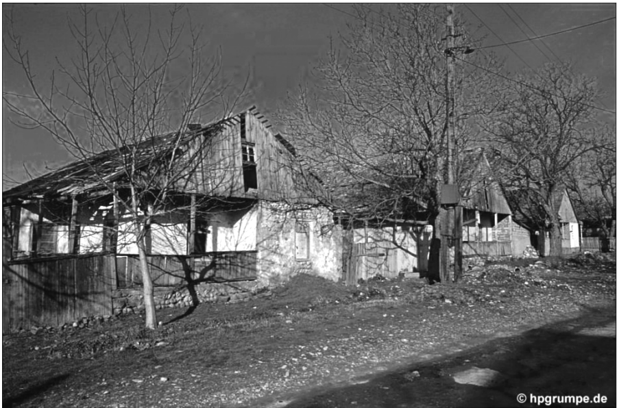
ს ა რ თ ი ჭ ა ლ ა . შ ვ ა ბ თ ა მ ი ე რ ა შ ე ნ ე ბ უ ლ ი ს ა