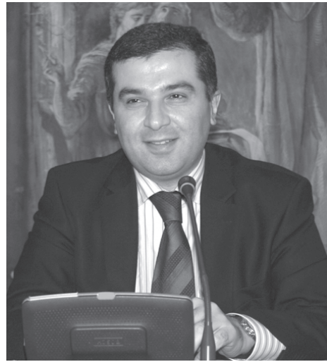
პროცესს აგვისტოს შეიარაღებული კონფლიქტი.

პარლამენტის თავმჯდომარის თქმით, ყველაზე ცუდი ინტერპრეტაცია, რაც რუსეთის მხრიდან კოსოვოს საკითხს მოჰყვა, ესაა გავლენის სფეროების დაბრუნება. რადგან მან ბალკანეთში გავლენა დაკარგა, უნდა შეერჩია ტერიტორია, სადაც თვითნებური ქმედებებით სამაგიეროს გადაუხდოდა დასავლეთს, განსაკუთრებით კი ამერიკას. საქართველო ამისთვის ყველაზე თვალსაჩინო მაგალითი იყო და მოჰყვა კიდევ ამ