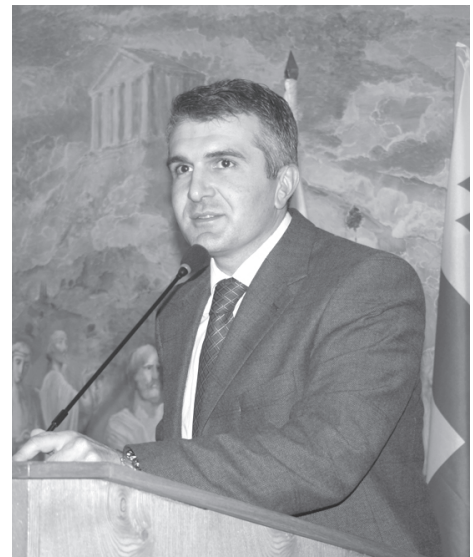
ყოველი მძლავრი საკუთარი ავტომობილის ტექნიკურად გამართვაზე იზრუნებს, პრობლემის მნიშვნელოვანი ნაწილი მოგვარდება“, – განაცხადა გიორგი ხაჩიძემ.

მინისტრთან შეხვედრაზე განხილვის ერთ-ერთი აქტუალური თემა თბილისში ჰაერის დაბინძურების პრობლემა იყო. სპეციალისტებმა ჟანგბადის ნაკლებობის გამოწვევები ძირითად მიზეზად ავტომობილების გამონაბოლქვი დაასახლეს, რომელიც მანქანის გაუმართაობის შემთხვევაში ორმაგად მავნებელი ხდება. არსებობს გარკვეული ეკოლოგიური საფრთხეები, რომლებსაც, ჯერჯერობით, ვერ ვუმკლავდებით. ჰაერის დაბინძურების საკითხი ძალიან მნიშვნელოვანი და სასიცოცხლო საკითხია. გარემოს დაცვისა და ბუნებრივი რესურსების სამინისტროს ზუსტად ასეთი პრობლემების მოგვარებისას სჭირდება საზოგადოების მოკავშირეობა. თუ