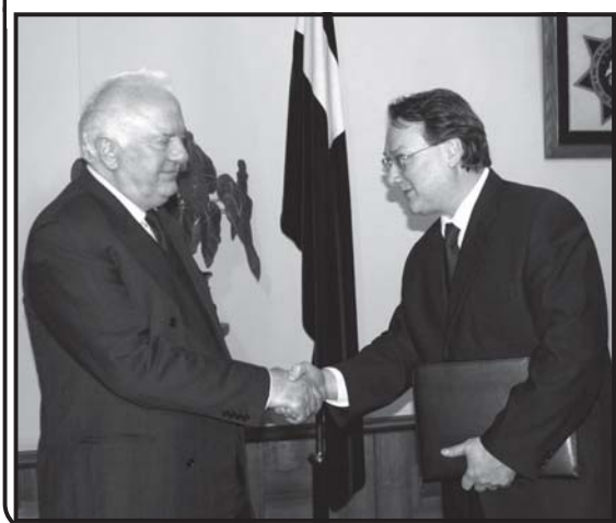
საქართველოს რკინიგზის კომპანია და საქართველოს საგარეო უწყებების ხელშეწყობით...