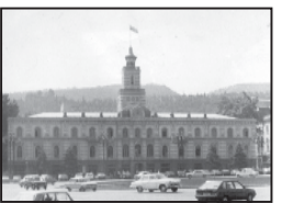
რეკონსტრუქციის სამუშაოები... იანვრის პენსიების გაცემა...