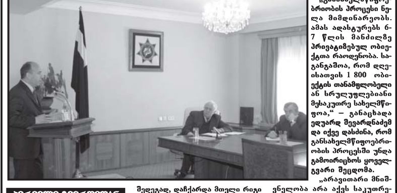
„განსახელებული“ პრიორიტეტების განხილვის შედეგად.