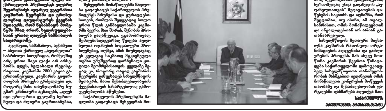
„ამლანელები“ მზად არიან, დადგინდნენ მათთვის საფარჯლოც.