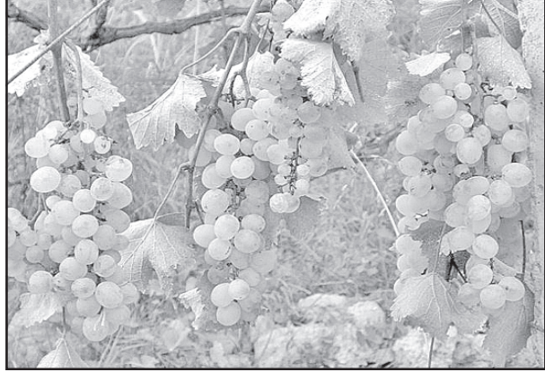
ცნობილი გახდა, რომ სახელმწიფო ბიუჯეტიდან ყურძნის სუბსიდირება წელსაც მოხდება. ოფიციალური ინფორმაციით, რომელიც სოფლის მეურნეობის

შეგახსენებთ, რომ შარშან ყურძნის ღირებულება ერთი ლარიდან იწყებოდა და 3 ლარსაც აღწევდა. ღვინის სუბსიდირების პროგრამა საქართველოში აქტიურად 2007 წლიდან დაიწყო. ღვინის ეროვნული სააგენტო წელს რთვლის საკომპლენტიაციოდ ორ შტაბს ქმნის, რომელიც თვალვსა და გურჯაანში განთავსდება. შტაბები მუშაობას აგვისტოს ბოლოდან დაიწყებს. იმუშავენს ცხელი ხაზიც.