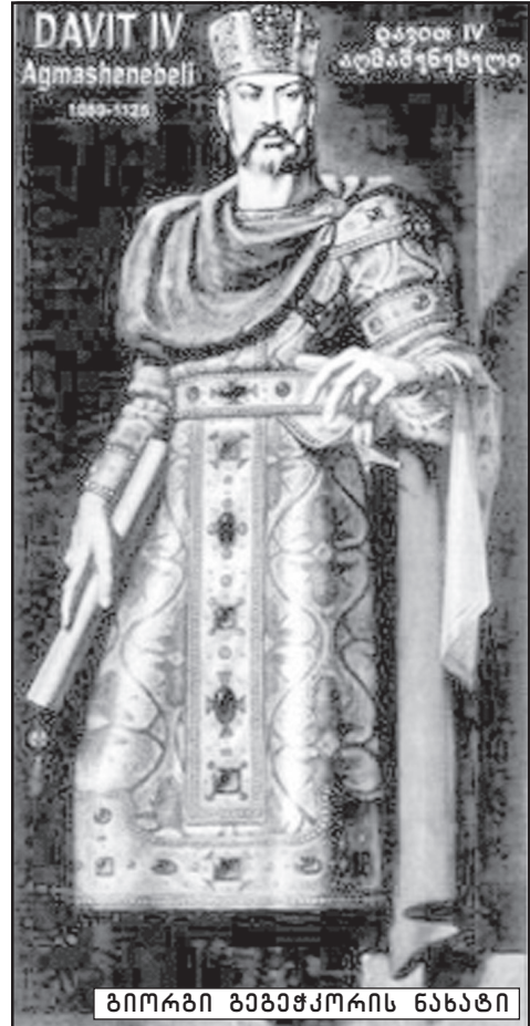
ბიორბი ბეგაშაქორის ნახატი

ფენილ მატებდა ეს ძალას მწირველ დედებს. უეცრად ჩრდილი მოედო არეს. შეკრთნენ სამნი. აიხედეს მალა. ზრქელი ღრუბელი იფინებოდა. განვლო ღრუბელმა: განთქა ჩრდილი. კვლავ ახალისდა ცხრათვალა მზე, ხალასი. შემკრთალთ გულს მოეშვათ - ხოლო ლოდინი კიდევ უფრო გაუმძაფრდათ. აპბერა სული მეორეხელ ამქმელმა ნაკვერჩხალს. აენთო ერთი ნატეხი სან-