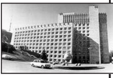
ბჭოს აღნიშნული გადაწყვეტილების მიხედვით, საბჭოს მინისტრთა დროებითი სხდომაზე ირაკლი მინაშვილი განაცხადდა, რომ მანდატი უზრუნველყოს საბჭოს მიერ. 18 თებერვალს ირაკლი მე-

ნაღარიძის მოსკოვში მიმდინარეობს საბჭოს მინისტრთა დროებითი სხდომა, რომელიც დასრულდება დღეს. უშიშროების საბჭოს მინისტრთა დროებითი სხდომაზე ირაკლი მინაშვილი განაცხადდა, რომ მანდატი უზრუნველყოს საბჭოს მიერ. 18 თებერვალს ირაკლი მე-