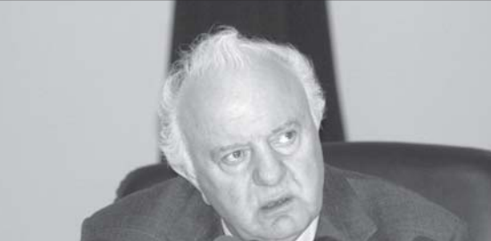
ბაგრატიის კალენდრის მანდატი უზრუნველყოფს საბჭოს მიერ. 18 თებერვალს ირაკლი მე-

ვაშლიანის ბაგრატიან დაკავშირებით, მაგრაბ, თუ გთხოვთ, ისევე როგორც სხვა კარგად მოხარული საქართველოს დასახმარებლად, გვირგვინს კიდევ რამდენიმე თვით გაგუგრძელოთ მანდატი სამშვიდობო ძალებს, რომლებიც, აგად თუ კარგად, უზრუნველყოფენ ძალზე მყიფე მშვიდობას ჩვენს რეგიონში“