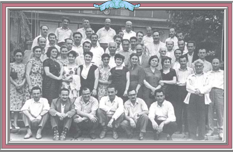
შპს-ის სახელმწიფო უნივერსიტეტის ფაქულტეტის 1952 წლის კურსდამთავრებულთა შეხვედრა 10 წლის შემდეგ. გაბაყალი 1962 წელს.