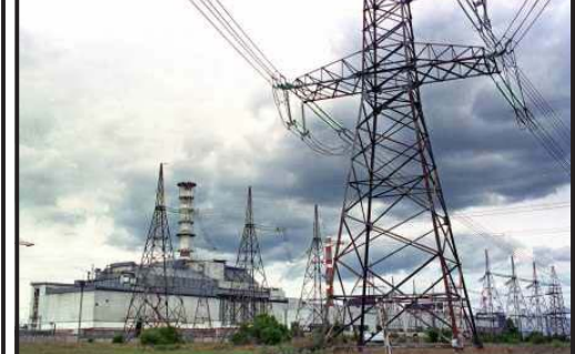
მა, როგორ ინვესტირებენ მუდმივად...