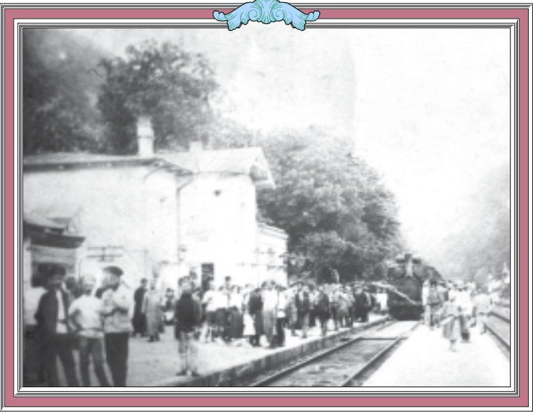
ბორჯომ-პარპოს რეინტეგრის ბაქანი. ბორჯომ-პარპოსის სარკინიგზო ხაზის გახსნის დღეს. 1902 წ.

ფოტო მოგვითხრობს მისივე თხარბა. ტელ: 99-66-10.