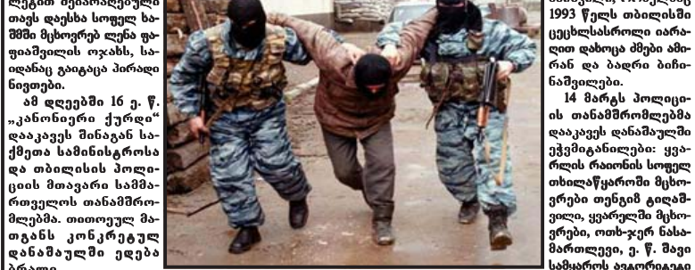
ცოცხალ-მკვდარი ტახტუკი სეზე ჩამოჭკიდეს... ცოცხალ-მკვდარი ტახტუკი სეზე ჩამოჭკიდეს.