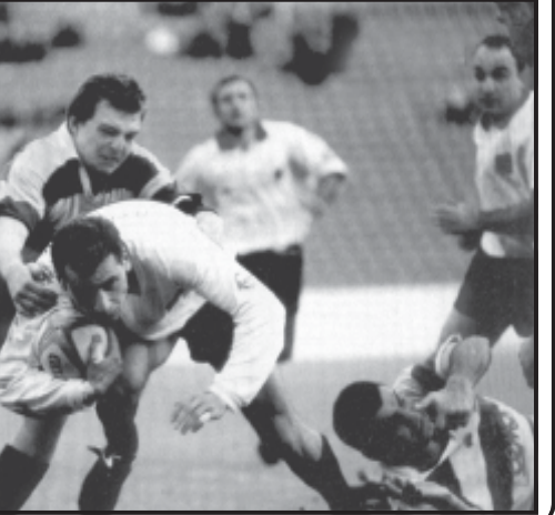
ბორჯღალოსნები ევროპის ცენტრში... ბორჯღალოსნები ევროპის ცენტრში.

„ბორჯღალოსნები“ — ევროპის ცენტრში... ბორჯღალოსნები ევროპის ცენტრში.