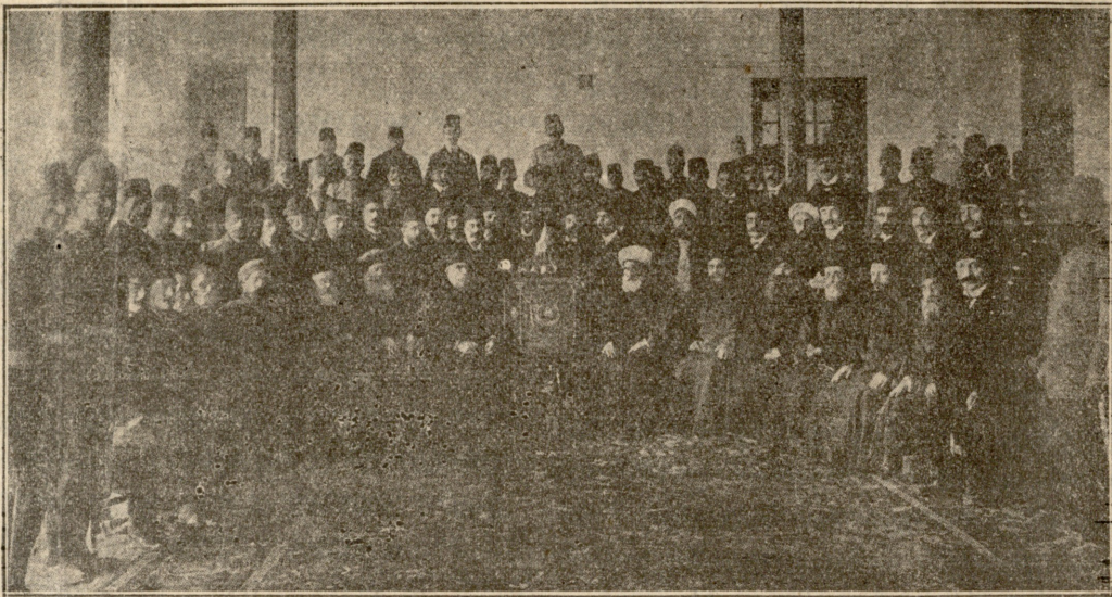
საპარლამენტო არჩევნები ოსმალეთში.